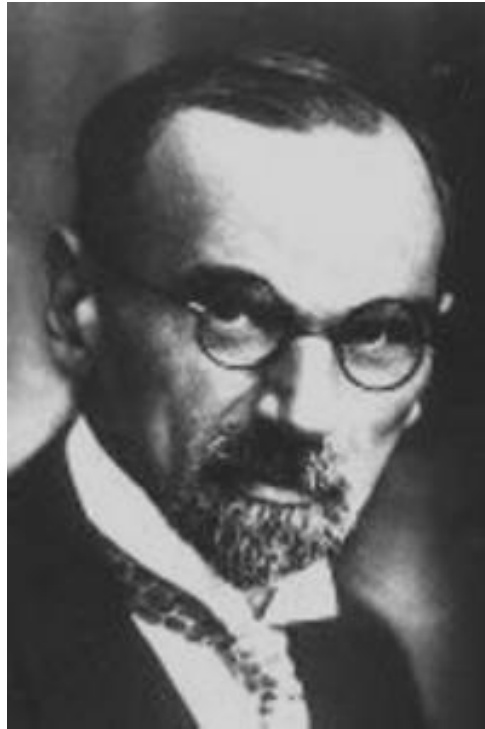
Отто Лібман, філософ-неокантіанець, що сформував клич "Назад, до Канту!".

З огляду на це неокантіанський лібералізм відігравав подвійну роль: він був одночасно позицією відступу ідеологічного самовиправдання буржуазії і природною філософією сліпоти дрібнобуржуазних інтелектуалів. Це тому, що цей ідеологічний відступ мав не лише тактичне значення, а ще й влучний соціальний сенс. Буржуазія, розчарована у спробах віднайти лібералізм у своєму реальному світі, щасливо відкрила його в ірреальних сподіваннях дрібної буржуазії. Через неможливість виправдати своє існування за посередництвом того, чим буржуазія була насправді, вона змусила своїх шанувальників співати хвалебних пісень, і щоб вони краще співали, їх розподілили по факультетах. У цьому лібералізмі професорів можна виявити, крім реальних економічних і політичних вимог висхідної буржуазії, устремління дрібної буржуазії, яку розчавила і відкинула до пролетаріату буржуазна економіка, але яка всупереч очевидності прагне піднятися до великої буржуазії. Історія цього лібералізму - це ніщо інше, як історія того, як буржуазія змогла зробити своїх жертв своїми виправдовувачами.