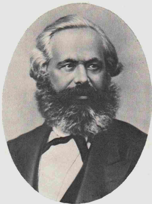
KARL MARX (1818 — 1883)