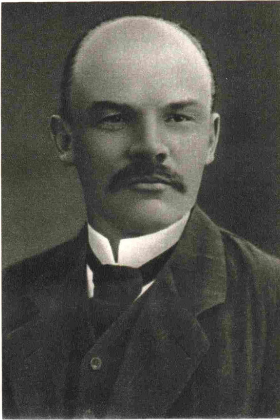
V. I. LENIN 1910