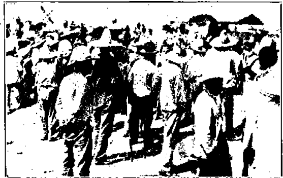
Meksikolaista maalaisväestöä juhlikunnossa

Meksikon väestö on melkein kokonaan maalaisväestöä. Suurin osa niistä on intiaaneja, tai sekarotuisia (mestizo). Viimeisen väenlaskun mukaan intiaaneja on 4,179,450 ja sekarotuisia 8,504,560. Vielä niin myöhään kuin 1910, suuri