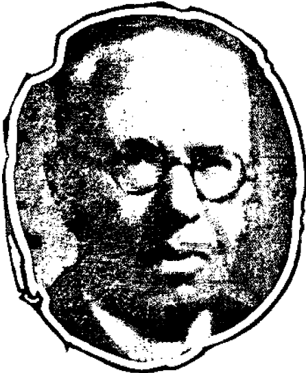
Pascual Ortiz Rubio, Meksikon nykyinen ja 10:nnes pres. — Ei ole vielä tapettu

Mutta ilman ulkomaalaisen pääoman valloitusretkiäkin Meksikossa on omat ristiriitansa, jotka