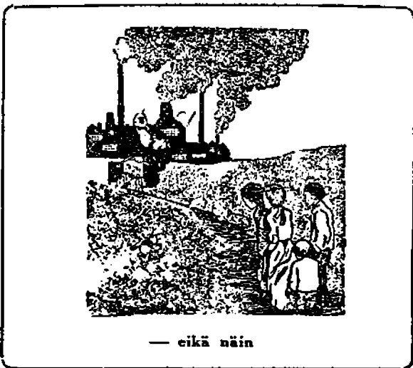
— eikä näin

“Haluan kiinnittää lukijain huomion tähän ajatukseen: Kasvatuksen kaikki arvo lepää siinä, että luotetaan ja annetaan arvo lapsen fyysillisyydelle, älyllisyydelle ja moraalille tahdolle Niinkuin tiede voi jotain näyttää toteen vain todistusten avulla, niin voi olla todellista kasvatustakin vai se, mikä on kokonaan vapaa kaikesta dogmaattisuudesta, jättäen lapselle itselleen pyrkimystensä suuntaamisen ja eteenpäin menonsa