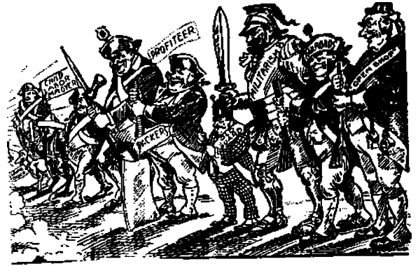
Työväenluokan järjestyneet viholliset.

K UKAPA kansainvälistä työväenliikettä seurannut työväenluokan jäsen ei jo olisi tietoinen siitä, että Vappu — ensimmäinen päivä toukokuuta — on kansainvälinen työläisten juhlapäivä! Kukapa työväen sanomalehtiä ja kirjallisuutta lukeut henkilö ei olisi tutustunut Vapun päivän työväen juhlapäivänä viettämisen historiihin, siihenmiten sen juhlminen on saanut alkunsa j. n. e.! Kukapa vallankumouksellisessa työväenliikkeessä pitemmän aikaa mukana ollut työläinen ei olisi itse persoonakohtaisesti tavalla taikka toisella ottanut osaa tämän päivän juhlmiseen.