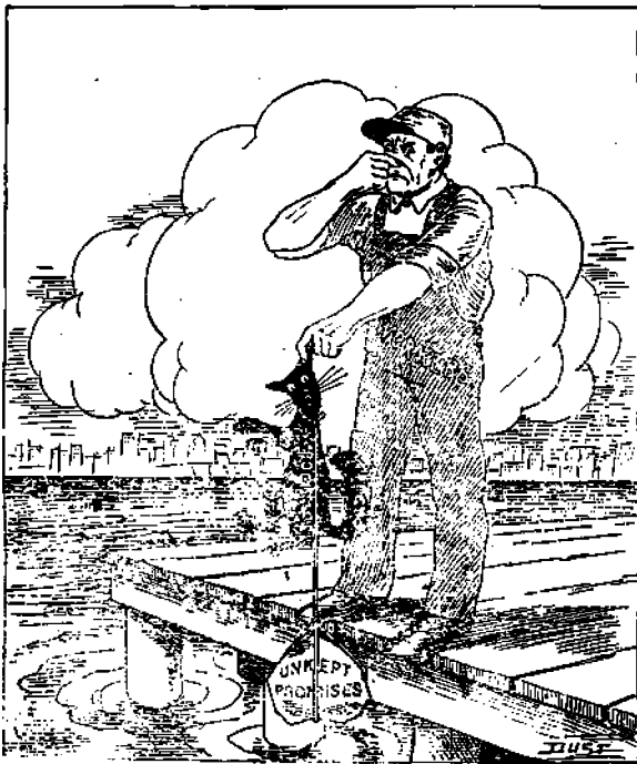
Vanhatkin politilliset lupaukset vielä haisevat.

Vaalien tulokset osoittavat Saksasta kiihoittuneen mielentilan nousemisen liittoutuneita vastaan, sillä entisen liberaalipuolueen yhtyminen hallitukseen, ja taantumuksellisten puolueiden voimistuminen vaaleissa, näyttää selvästi liittoutuneita vastaan kasvavan hyökyaallon nousemista; että reveche-aalto on Saksassa nousemassa, ja että se on läheisesti yhdistettynä vastavallankumoukselliseen liikkeeseen, Saksan porvariston keskuudessa. Liittoutuneiden lehdistökin merkkää Saksan vaalien tulokset merkinannoksi nousevalle myrskylle, ja siinä se onkin oikeassa. Tämä vahvistaa puolestaan Ranskan anastuspolitiikan kannattajien mielipiteitä, ulkonaisten luovutusten asiassa, mikäli niitä edistää Lloyd George. Vaalien jälkeiseen aikaan siirretty Span konferenssi, jossa liittoutuneiden piti päästä jonkinmoiseen yhteisymmärrykseen, Versaillen rauhansopimuksien muutoksien suhteen, sattui niinollen