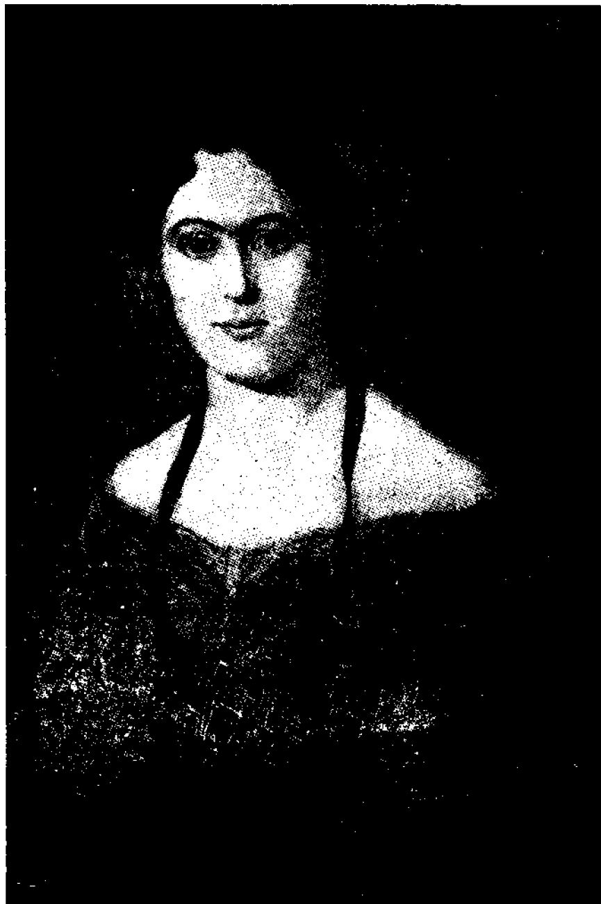
Johanna Bertha Julie Jenny von Westphalen.