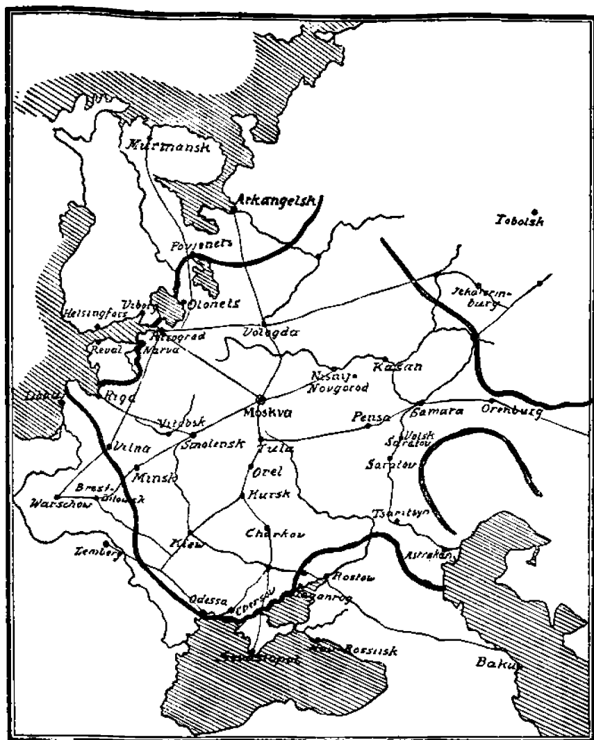
Neuvosto-Venäjän eurolaiset rintamat mualliskuulla v. 1919.

leet keskusvaltain valloitusjoukkojen sliplen suojassa, osottautuivat aivan kypsymättömäksi itsenäiseen taisteluun. Senpätähden kävikin puhdistus taantumuksellisista laajoilta alueilta lounaassa suhteellisen nopeasti, ja muutamaa kuukaudessa muodostui eteläisille rajamaille neljä veljestasavaltaa.