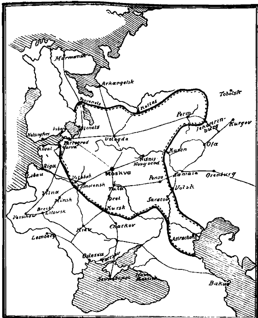
Neuvosto-Venäjä elokuussa v. 1918.

vastavallankumous alituisesti punaisten alimman Volgan seutuja Tsaritsyn ja Astrakanin ja pohjois-Kaukasuksella pyrki se Kaspian meren rannoille voidakseen siellä solmia suhteita englantilaisten Bakun rintaman kanssa. Neuvosto-Venäjän alue tänä vaikeimpana aikana selvenee ylläolevasta kartasta.