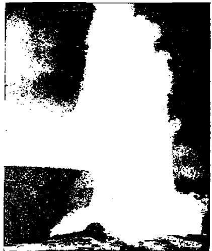
Vanha uskollinen geysseri

*) Yellowstone eri hotelleihin ajavat sadat miehit heinä y. m. tarpeita Tavallisesti suuren heinäkuorman edessä on 10, 12 jopa 16 hevosta. Kun tulee ilta, tai ajuri arvelee tarpeeksi paljon päivän mittaan kulkeneensa, pysäyttää hän hevoset tienoheen, pystyttää teltan kuormansa viereen, panee yhdeille hevoselle kellon kaulaan ja laskee hevoset vuoristosta elatuksensa etsimään. Heinämies itse keittää ja paistaa ruokansa telttansa eteen laittamallaan tulella ja nukkuu yönsä teltaessaan, miten hyvin ja rauhallisesti, se tietysti riippuu luonteen laadusta ja tottumuksesta villieläinten läheisyydessä — ja melkeinparissa — yötyään viettää.