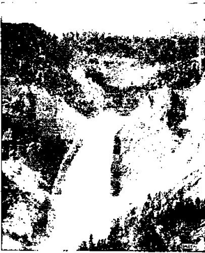
Yellowstonen suuri putous

sen totuuden, että emme olekaan vaapaalla alueella ollessamme Yhdysvaltain kansallispuistossa.