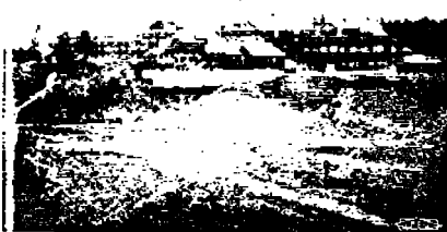
Eräs Yellowstone puiston hotelleista

Me palasimme heinämiesten majalle, sinne, missä olimme käyneet tietä kysymässä. Miehet olivat juuri levolle menossa, kun "halloo"-huudolla ilmai-