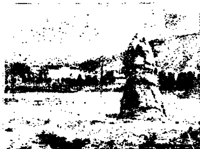
Mammoth hotelli ja "Vapauden lakk"i