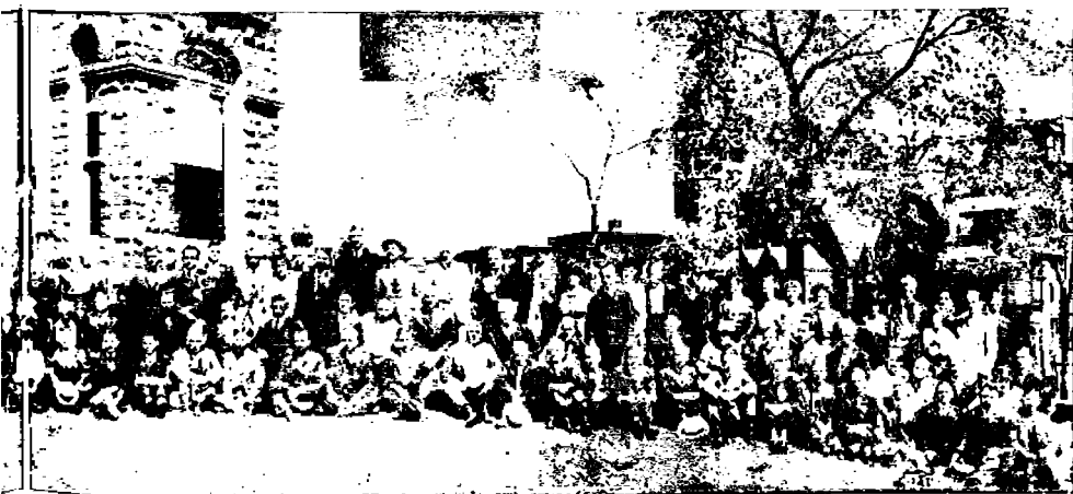
Club jäsenet Chicagossa, Elokuu 30—1919

Tuskin olimme ehtineet vielä montakaan mailia kävellä, kun saimme tuta