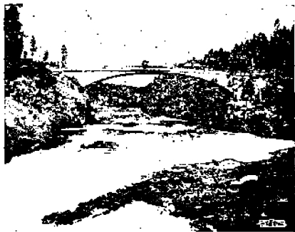
Silta erään Yellowstonein puiston joen ylityso