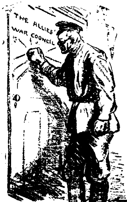
"Avatkaa ovi", huudahtaa Venäjän työväestö liittolaisille.

Rosvomaista peliä se salainen diplomatia. Suurta vehkeilyä se taistelu "kansanvallan ja kansojen vapauden" puolesta.