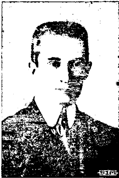
Venäjän pääministeri Kerenski.

Nykyinen tilapäinen viisihenkinen ministeristö ei kaikesta päätäen tule olemaan pitkäaikainen. Ainakin työläisten kongressin pakotuksesta tulee tekemään muutoksia, ellei jo aikaisemmin.