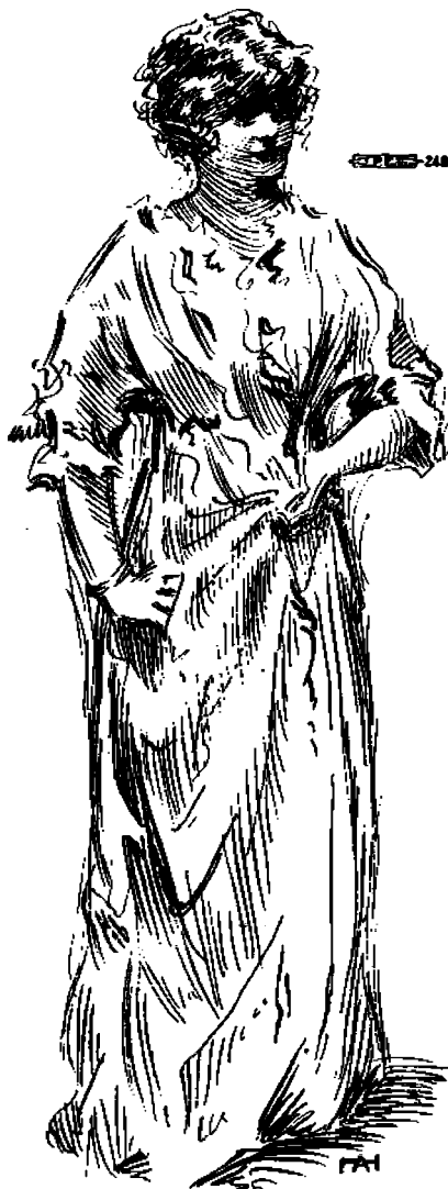
"Melkulaista olikin miellyttävä nainen..."

käytäntöön sitten kun sosialistit alkoivat johtaa asioita. Nyt kun yhteiskunta omistaa kaikki yleiset laitokset käy tällainen päänsä kiitettävän