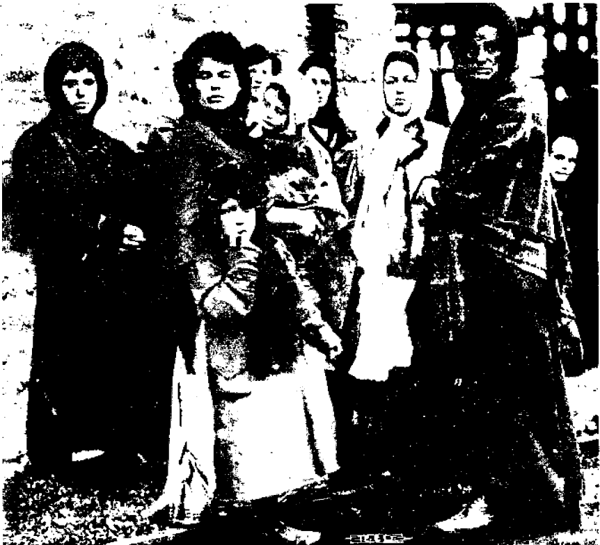
Tyypillisiä kalvantomiesten vaimoja.

muillakin aloilla, sama työ on tehtävä. Työläisten on ymmärrettävä, että suuria järjestöjä ei luoda tulisilla puheilla, mutta vain sitkeällä työllä. Ei ole myöskään työväenjärjestölle otollista syöksyä suin päin taisteluun ottamatta huomioon voiton mahdollisuuksia. Järjestön säilymisen ja edistymisen tähden lakko on pidettävä vain viimeisenä keinona. Hiilenkaivajain järjestö on oppinut sen taisteluistaan. Mitä suuremmaksi ja voimakkaammaksi järjestö on tullut, sitä harvemmin se turvautuu lakkoon. Ja suuren järjestön tarvitsee vain harvoin lakkoon turvautua. Y. M.