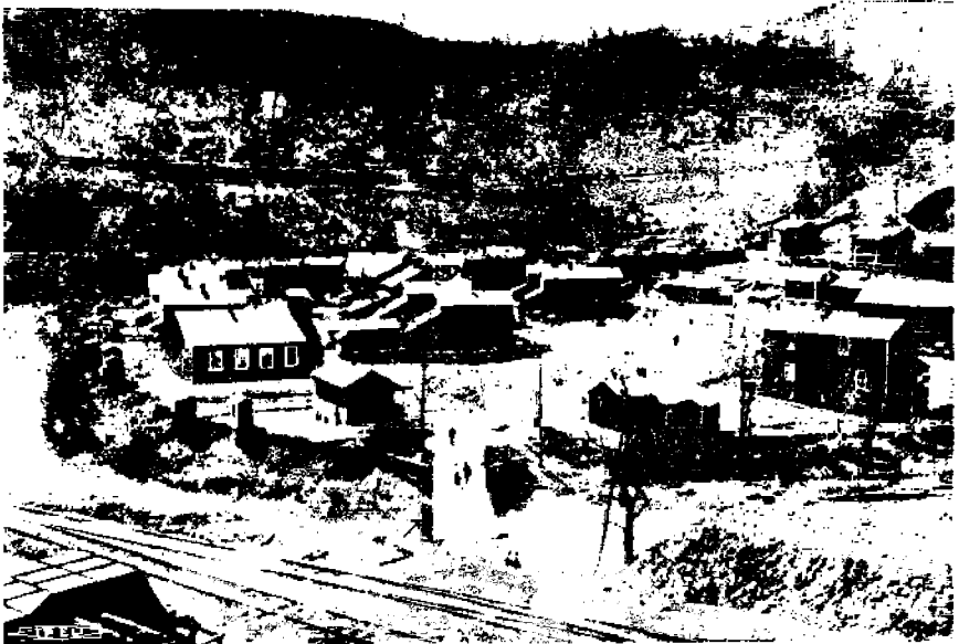
Pehmeän hiilen kaivoskylä.

vät loven köyhän miehen niukaan kassaan, kuten yleinen väite kuuluu.