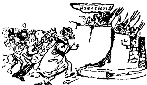
He syöksyivät vimmatusti rikkoutunutta seinää kohti.

Saatanana tuli yhä enemmän vakuutetuksi, ettei hän halua tätä joukkoa.