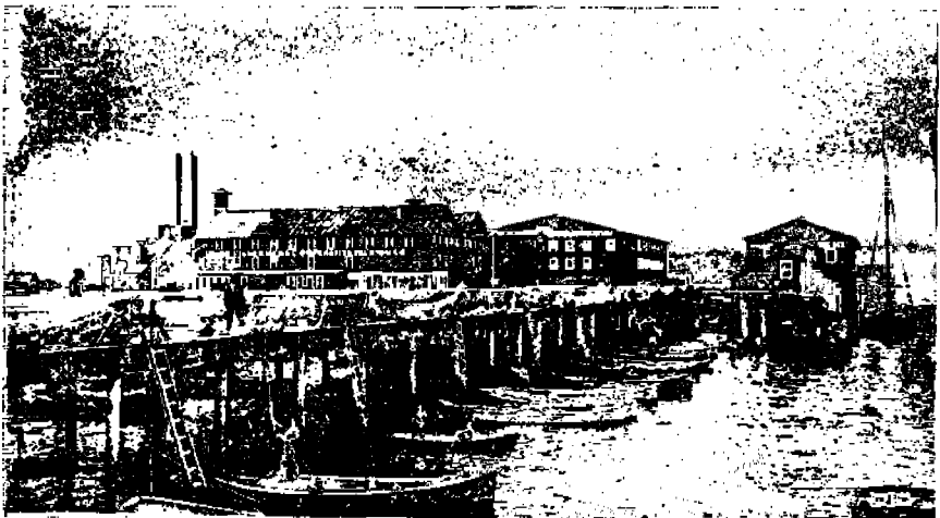
Verkko, joka on ollut "rekalla" kuivamassa, asetetaan venheeseen!

Mutta siltikin ohjaa hän sinne Pienen purtensa verkkoiheen Siihen käskepi puutteitten enne Ja kurjuuden kauhuineen.