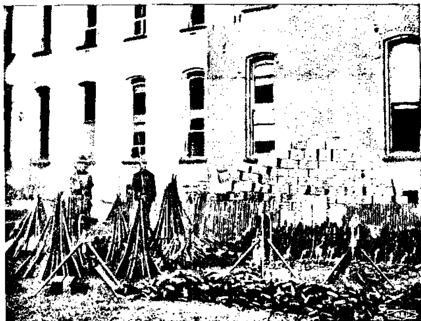
Kaivosyhtiöiden varastosta takavarikoituja ampuma-aseita ja ampuma-

täydellisin, aina kivääreistä kuularuiskuihin saakka, mutta se tapahtui — mikäli sanomalehtikertomuksiin saa luottaa — pelkästä kateudesta, että yhtiön pyssyhurtat olivat paremmin varustettuja kuin itse valtion sotavoima. Niin hyvin teki sotaväki kuitenkin palvelustaan kaivosyhtiölle, että "rauhan" ja "järjestyksen" palaututtua ja valtion virallisen sotaväen käytyä sillä kertaa tarpeettomaksi, yhtiöt