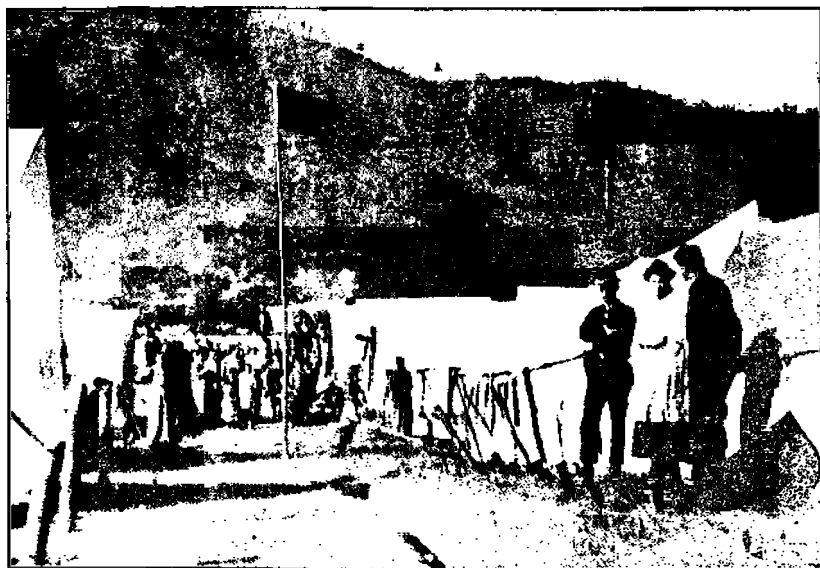
Lakkolaisten telttoja ja Yhdysvaltain lippu "suojana"

kyväsien ja näkymättömän kaivos-ten ympärillä ja kylissä, joissa kaivosmiehet asuvat, alkoivat palkkaamaan lakonrikkureita kaivosiin ja "kaivosvalteja", muka turvaamaan kaivosomaisuutta ja lakonrikkurien rauhaa, mutta joiden tehtäväksi todellisuudessa tuli lakkolaisten sanoin kuvaamaton vainoaminen. Kaivosmiehet ajettiin perheineen pois asunnoistaan, jotka tietysti yhtiö omisti, paljaan