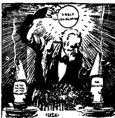
Pres veto-vullan ja senatin poistaminen.

se on kiinteä ja muuttumaton. Järkevästi se ei voisi muuten ollakaan. Sosialistipuolue on perustettu määrätyn yhteiskun- nallisen ja poliittisen tehtävän suorittamiseksi. Sen ohjelma on vain ilmaus tästä tarkoituksesta ja ilmoitus askelistasta, joiden kaut- ta se ajetaan toteuttaa. Niin kauan kuin tämä tehtävä on suo- rittamatta ja niin kauan kuin puolue pysyy kiinni päämääräs- sään, periaatteessaan ja menet- elytavoissaan, niin kauan sen ohjelman perusosan täytyy pysyä muuttumattomana.