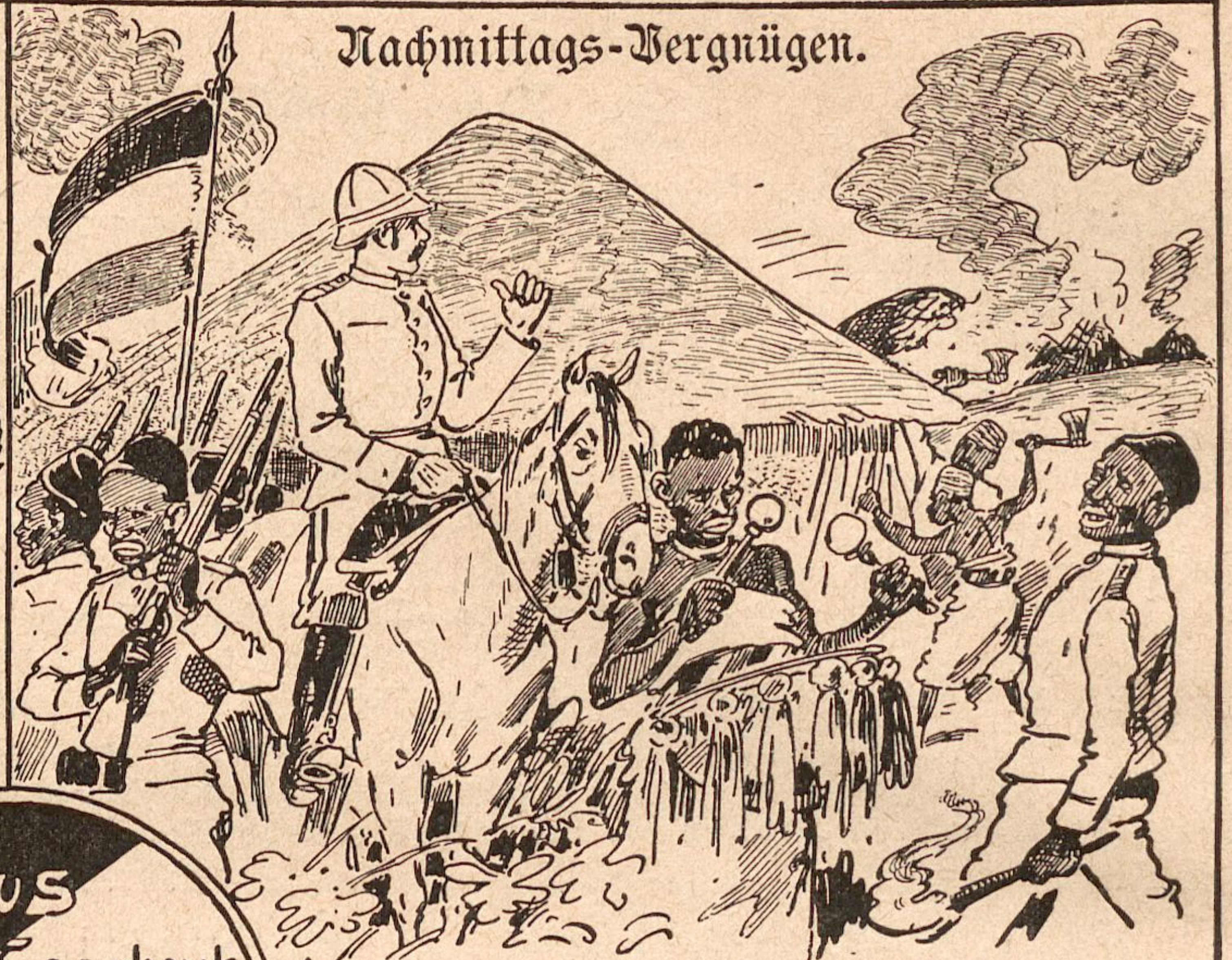
„Bis 1/25 Uhr wurden zwölf Dörfer der Wagogos verbrannt.“