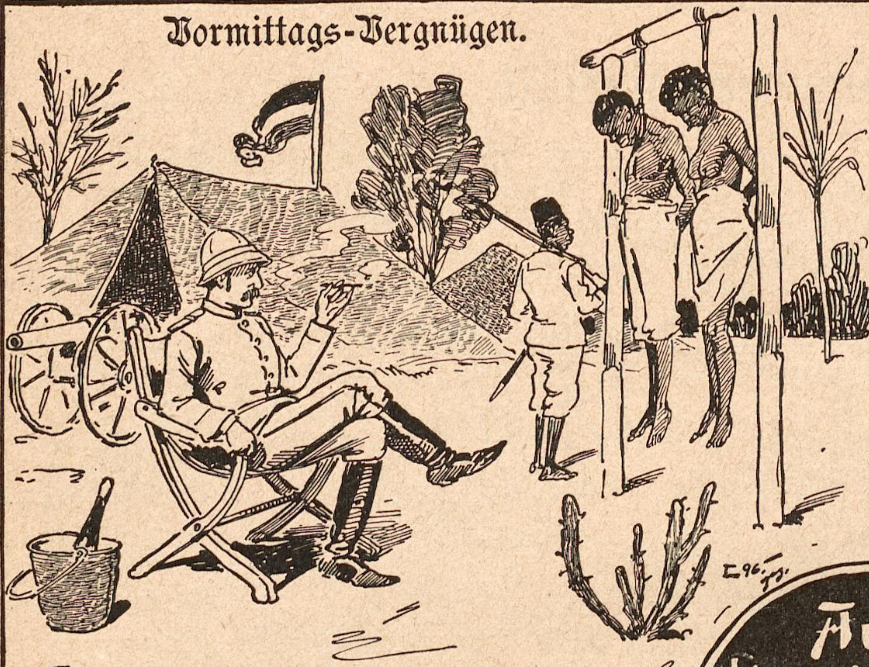
„Die Sicherheit der Station beruht nur auf Furcht vor mir.“