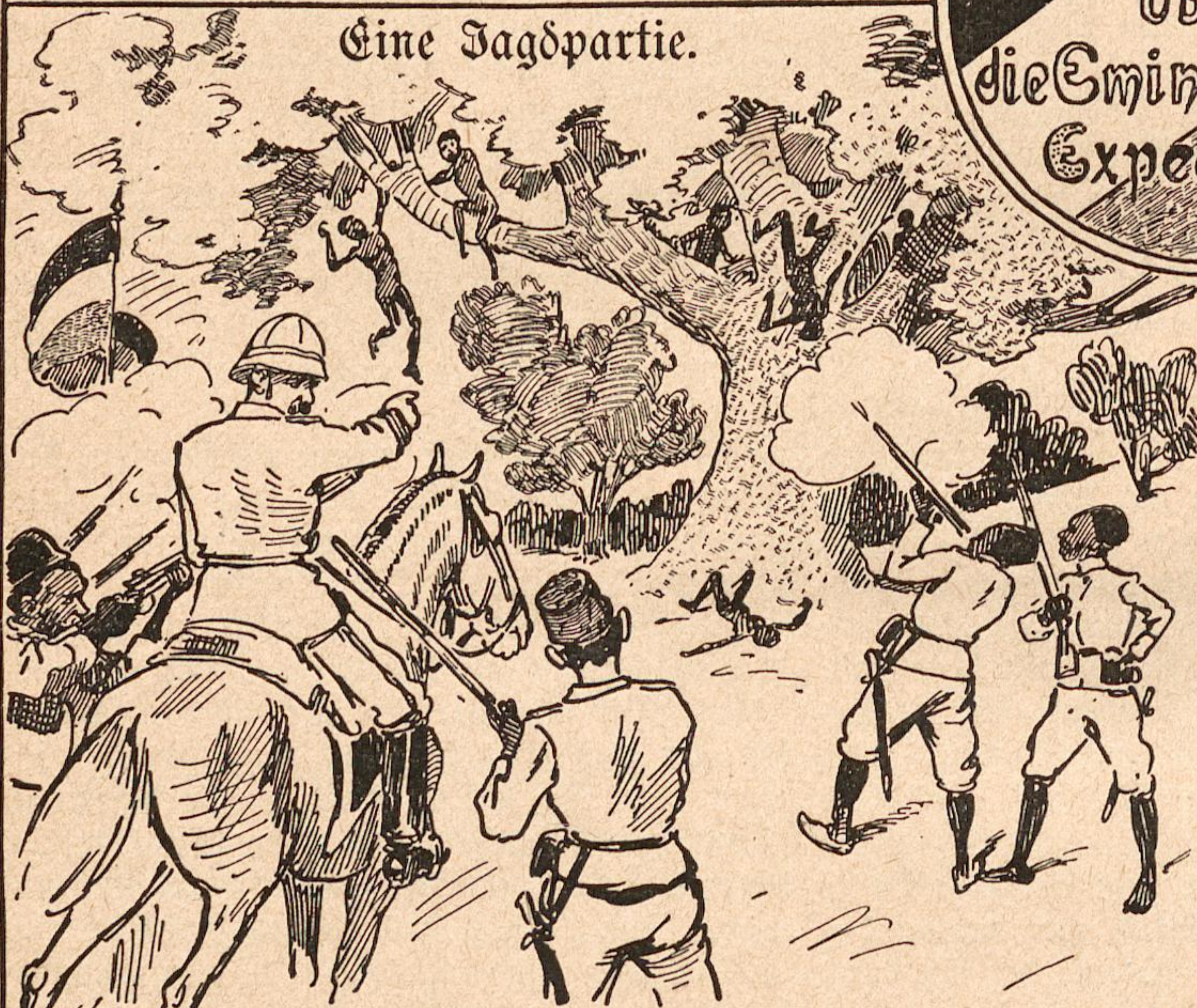
„Wir haben die Neger wie Spazzen von den Bäumen geschossen.“