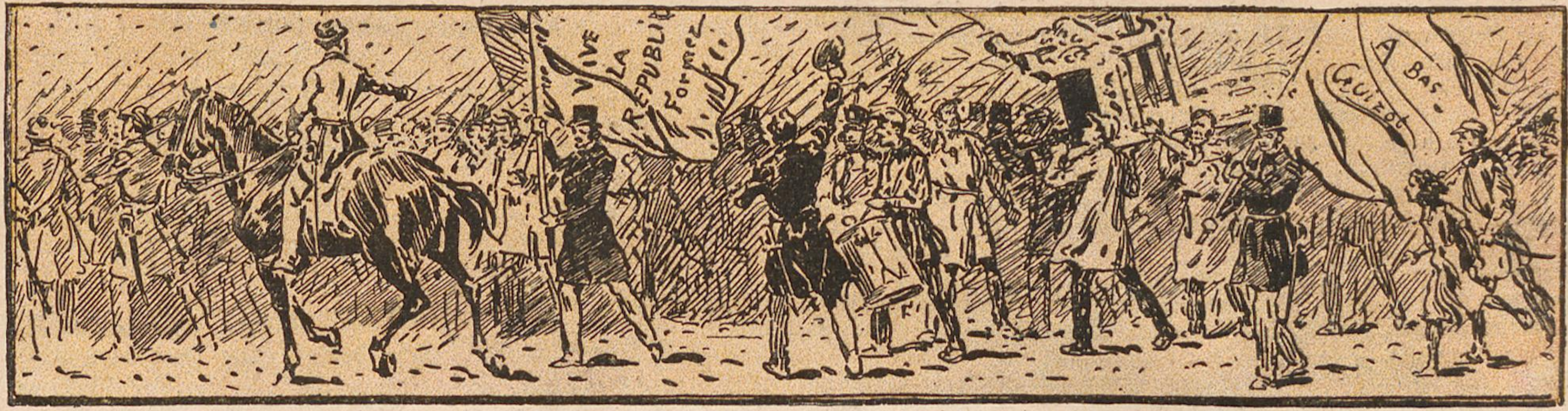
Die Pariser führen den Thron Louis Philipps nach der Julisäule.