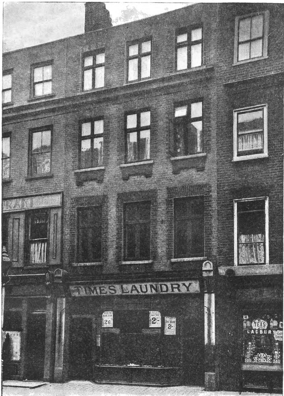
Дом в Лондоне (28, Dean-Street, Soho), в котором жил Маркс с семьей с 1850 до 1857 г.