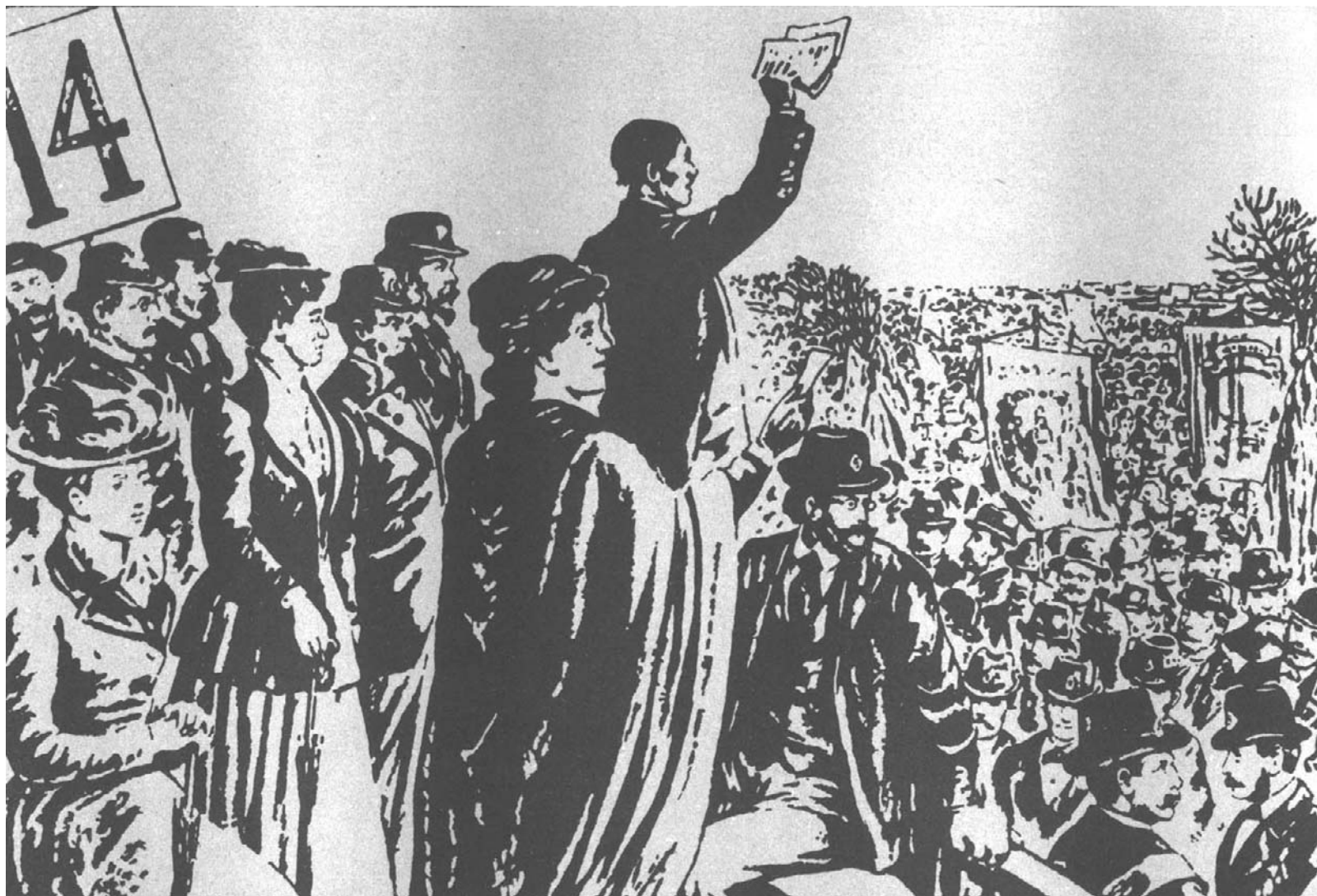
Трибуна №14 в Гайд-парке на первомайской демонстрации 1892 г. в Лондоне. Среди присутствующих на трибуне — Ф. Энгельс Рисунок из газеты «Daily Graphic»