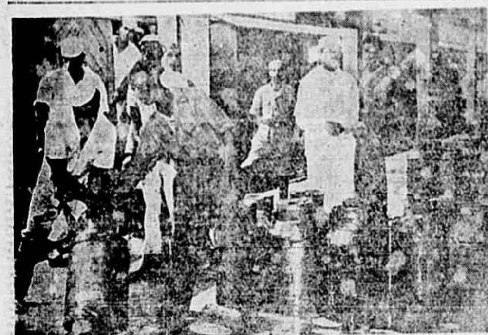
Trabalhadores da U.C.P.L., descarregam de um vagão da Central do Brasil os pesados vasilhames de leite.

Representantes dos principais setores da empresa junto à Comissão Unificadora estiveram ontem, em nosso jornal - Ganha maior impulso a campanha de apoio ao projeto de realização de eleições sindicais - Abono de Natal e Regulamentação das Folgas são as reivindicações mais sentidas - Viva e ativa a solidariedade entre os trabalhadores da Light Representantes dos principais setores da empresa junto à Comissão Unificadora estiveram ontem, em nosso jornal - Ganha maior impulso a campanha de apoio ao projeto de realização de eleições sindicais - Abono de Natal e Regulamentação das Folgas são as reivindicações mais sentidas - Viva e ativa a solidariedade entre os trabalhadores da Light