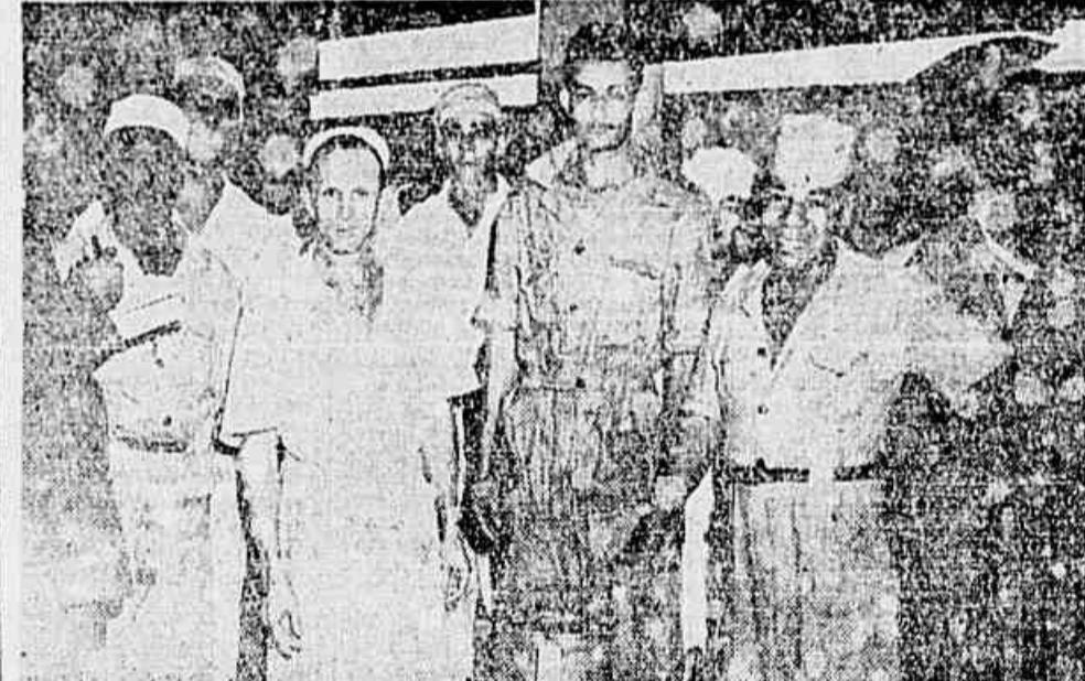
Empregados da Cooperativa Central dos Prod. Leites do Leite, fazem a nossa reportagem sobre as suas reivindicações mais sentidas.