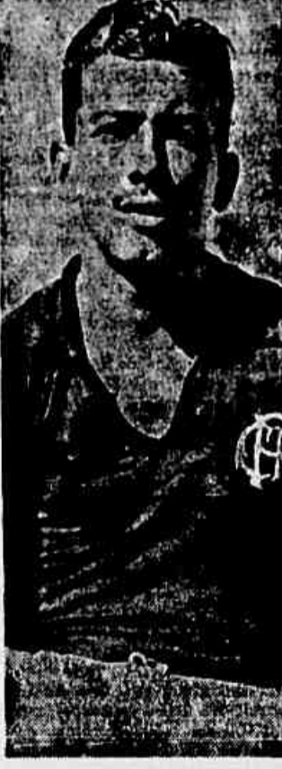
Bigua, o médio rubro-negro reaparece no encontro de hoje