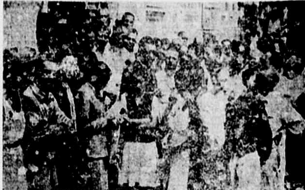
A princípio acanhados, logo depois confiantes e seguros, os trabalhadores que aqui se encontram felicitaram longamente o deputado Abílio Fernandes e a redatora acerca de suas reivindicações e da sua vontade de lutar em defesa da Constituição

antiquada e em péssimo estado de conservação. O trabalho é duro, remunerado muito pouco e os salários são pagos por desinteresse dos donos da empresa em aumentarem e melhorarem a qualidade da sua produção. Sofrem as consequências da crise que assolou o país, do sub-consumo progressivo e da concorrência da manufatura similar importada e lançada nos mercados internos a preços inferiores aos da produção nacional. Os operários que trabalham na fábrica são assalariados e recebem em salários de 10 a 15% acima do mínimo estabelecido pelo Ministério do Trabalho. Apesar disso, os empregadores não têm qualquer preocupação com o bem-estar dos seus empregados, não lhes dão férias, não lhes dão seguro, não lhes dão gratificação de despedimento e não lhes dão pensão por invalidez. O salário é pago em espécie e o empregado tem de se preocupar com a alimentação e a casa. A situação é muito precária e os operários vivem em condições de extrema pobreza.