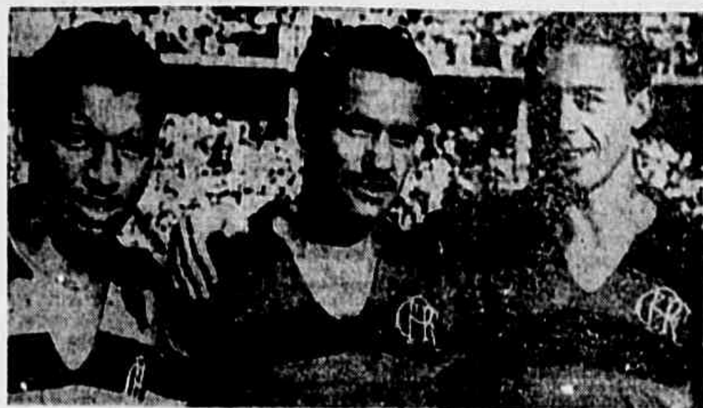
Se Perácio aprovar o trio central do Flamengo será este acima, com o deslocamento de Jair para a ponta esquerda

EM DISCUSSÃO HOJE Na sessão de hoje, entretanto, não terão êxito em suas manobras. O projeto será discutido e aprovado pela grande maioria dos representantes cariocas, que se colocaram ao lado do povo, restando assim, a discussão final do assunto o que deverá ser feito ainda esta semana. Que a batalha do estádio será ganha não há dúvida alguma.