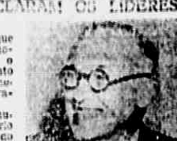
Pietro Nenni, lider socialista

PARIS, setembro. (Por avião) Especial para a TRIBUNA POPULAR - O centro cultural da Associação França - URSS recebeu ontem, 9 de setembro, a visita de uma delegação do partido soviético.