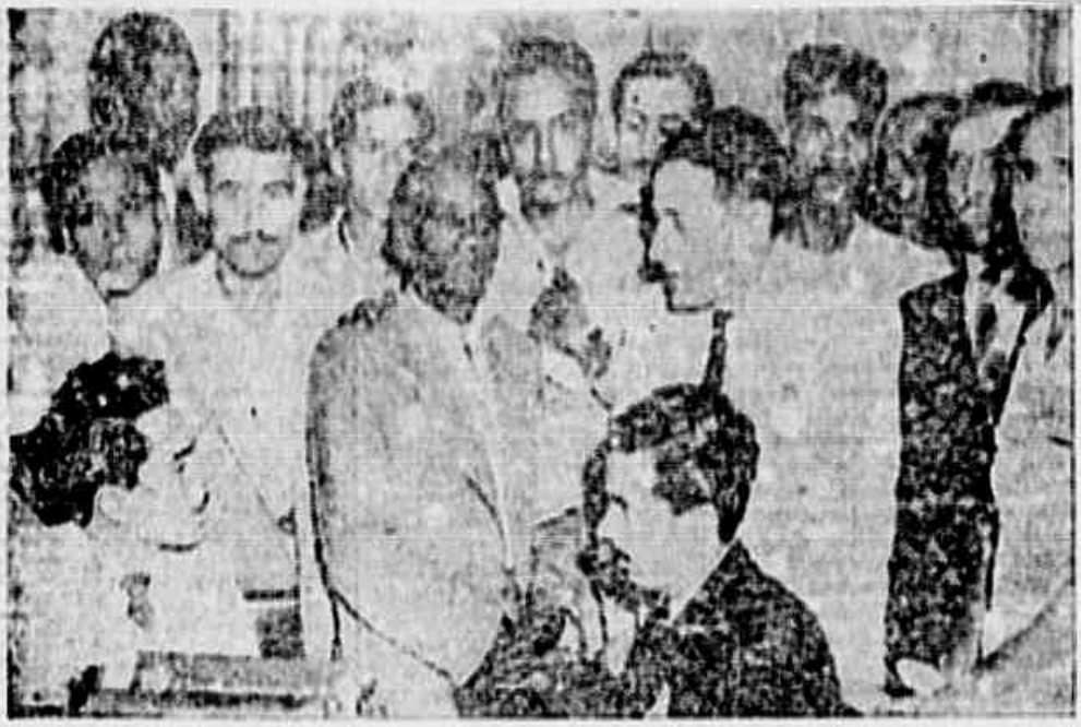
Trabalhadores marmaristas quando em nossa redação afirmavam o seu apoio à direção legal do Sindicato