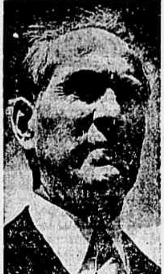
Sr. Oswaldo Aranha, delegado do Brasil, eleito presidente da Assembleia Geral da ONU

O REPRESENTANTE DO BRASIL OBTVEVE 29 VOTOS CONTRA 22 DO DELEGADO AUSTRALIANO, SR. EVATT - VISHINSKY, E MARSHALL FALARAO HOJE - FORAM ESCOLHIDAS TAMÉM AS AUTORIDADES DE TODOS OS COMITÊS