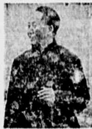
Mao-Tse-Tung, secretário geral do Partido Comunista Chinês