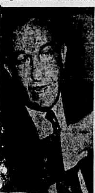
Sr. Benjamin Cohen, secretário-adjunto da ONU, que considera relevante a tese cubana

A proposta de Cuba sobre agressão econômica, lançada ontem em plenário pelo sr. Bell, é um dos temas apaixonantes destas 24 horas no seio