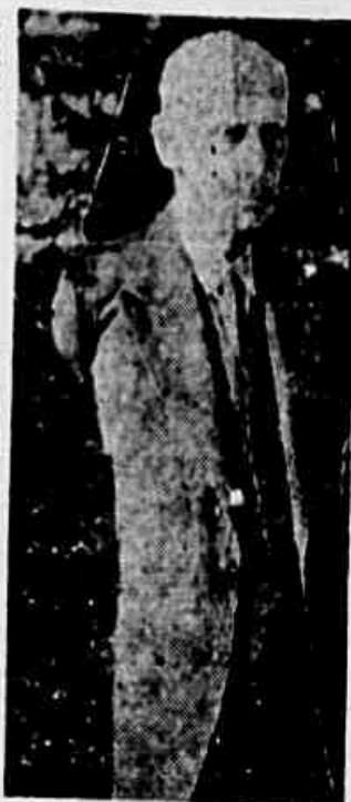
Ministro Raul Fernandes

Sabe-se por outro lado que os delegados americanos estão interessados em encerrar a Conferência até 1.º de setembro, o que confirma a certeza de que poucos resultados esperam deste conclave.