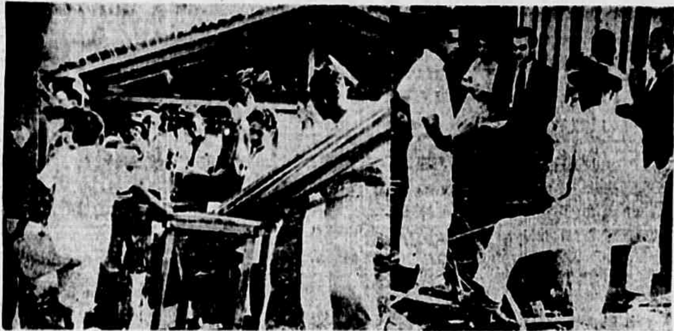
Junto aos destroços dos barracos, moradores da Favela do Esqueleto fazem a nossa reportagem