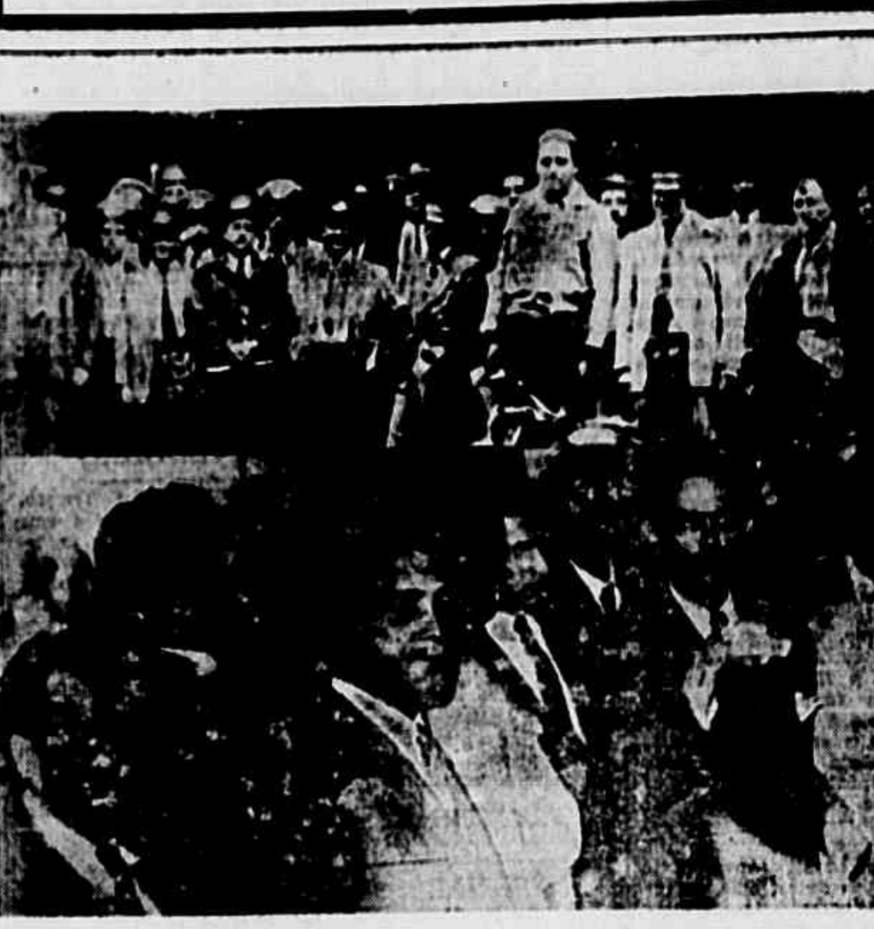
Na gravura acima aparecem os operários da Cantareira de frente da sede do seu Sindicato, onde foram impedidos de realizar uma assembleia, e um aspecto da visita que fizeram à Assembleia Legislativa onde protestaram contra a arbitrariedade policial.

(SOLIDO, LIQUIDO E PARA A BARBA) LABORATORIO FUNDADO EM 1890 ANTISSÉTICO E DESODORIZANTE Conserva a pele macia, juvenil, higienizada e perfumada INDISPENSÁVEL EM TODOS OS LARES