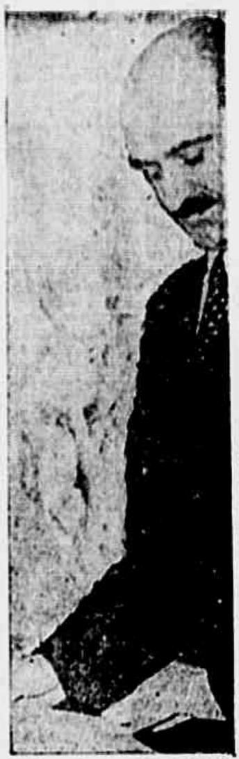
Ministro Lafayette de Andrada, presidente do STF