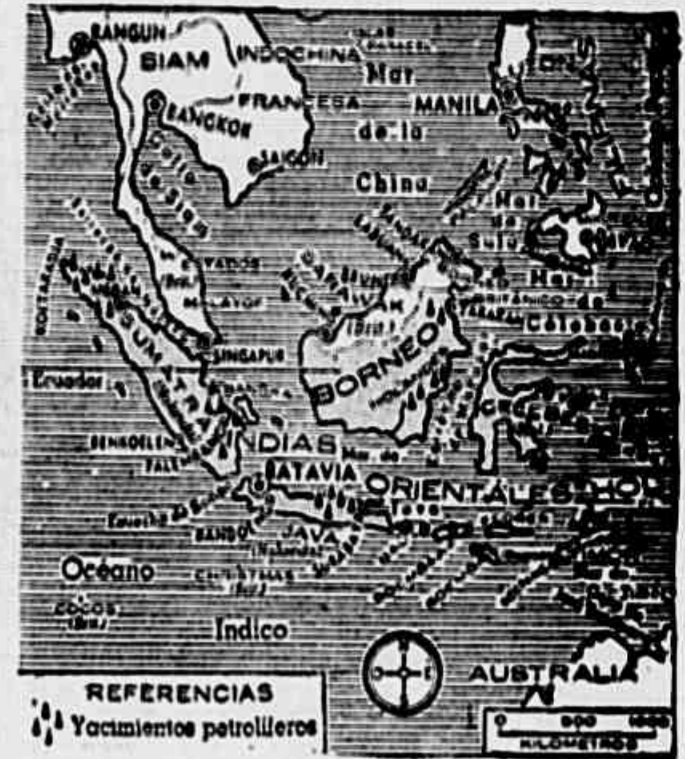
Mapa que explica facilmente a colcha da Indonésia pelo imperialismo: o mapa ao alto, extralido de "La Prensa", indica a localização das jazidas petrolíferas nas ilhas de Sumatra, Java, Borneo e Ceram

de organismos econômicos mistos para o financiamento das exportações locais; 4) ressação imediata das relações diplomáticas da república com as nações estrangeiras. Ano lançar o seu ultimatum a Holanda (ou melhor seu governo conservador) já estava preparada para o ataque, com aviões, navios de guerra e soldados concentrados. O ultimatum holandês foi reforçado por um "convite" dos Estados Unidos ao governo da Indonésia para devolver, sem perda de tempo, os bens e as propriedades expropriados dos cidadãos e empresas lanques. (Truman e Marshall resolveram agora intervir na vida íntima de todas as nações do mundo, opinando sobre o que elas não aceitam, como se o "Século Americano" imaginado pelo teórico do imperialismo de Wall Street, mister Luce, já fosse uma realidade e o mundo existisse sob o controle lanque...) O governo da nova república não se curvou diante das exigências holandesas, e faz poucos dias teve começo a expedição punitiva destinada a depoliar e a transformar novamente a Indonésia numa colônia. A ser desta vez explorada pelos magnatas de Haya de sociedade com o novo York, segundo a "doutrina" Truman... Por isso mesmo a delegação norteamericana se opôs, na ONU, a que a organização das Nações Unidas usasse da sua autoridade, para impor a cessação das hostilidades. O que Truman quise