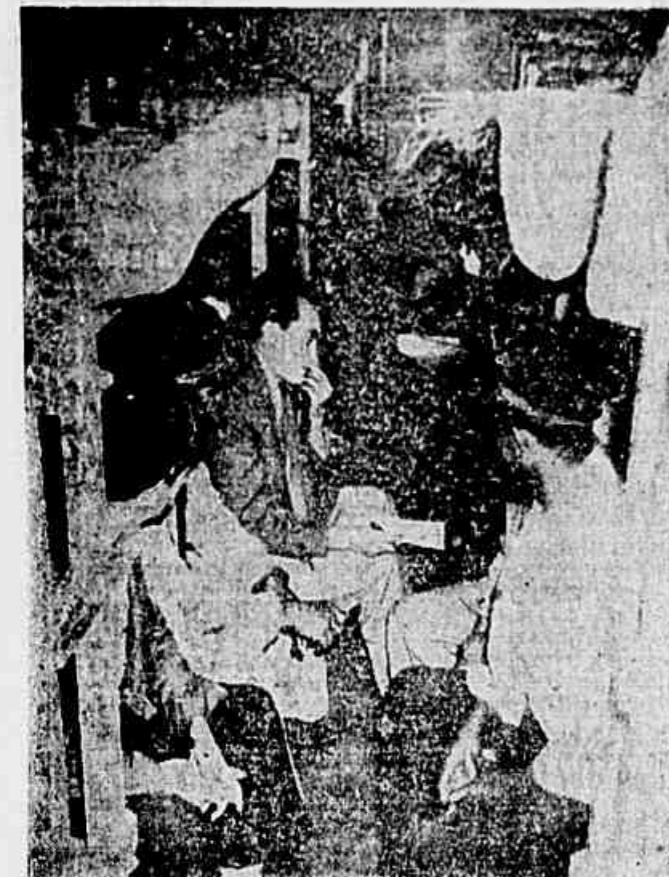
Nas horas de folga os trabalhadores discutem e analisam o importante documento que é o discurso de Prestes

NAS OFICINAS DA LEOPOLDINA, MAQUINISTAS, FOGUISTAS, MECANICOS, TORNEIROS E CONDUTORES FALAM A «TRIBUNA POPULAR» — AS PALAVRAS DO GRANDE LIDER DO POVO ANALISADAS E DISCUTIDAS PELOS TRABALHADORES, EM SUAS HORAS DE FOLGA — APLAUSOS A PROPOSTA DE UNIAO NACIONAL