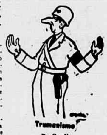
Tramocismo De Gaulle