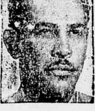
Blas Bazo, líder do povo cubano