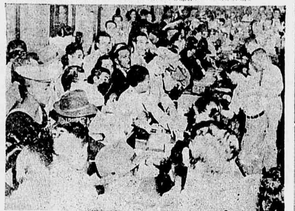
O povo forma filas enormes em frente do balcão das drogarias, à espera de que lhe vendam medicamentos

prateleiras, e a caixa dando voltas e voltas à procura da pequena registradora, que, de milto em milto, fazia o seu