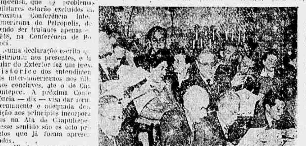
O sr. Raul Fernandes, ministro das Relações Exteriores, por ocasião da entrevista coletiva que ontem concedeu à imprensa

O sr. Raul Fernandes reuniu, ontem, em entrevista coletiva aos representantes da imprensa, que os problemas militares estarão excluídos da próxima Conferência Inter-Americana de Petrópolis, devendo ser tratados apenas em 1948, na Conferência de Bogotá.