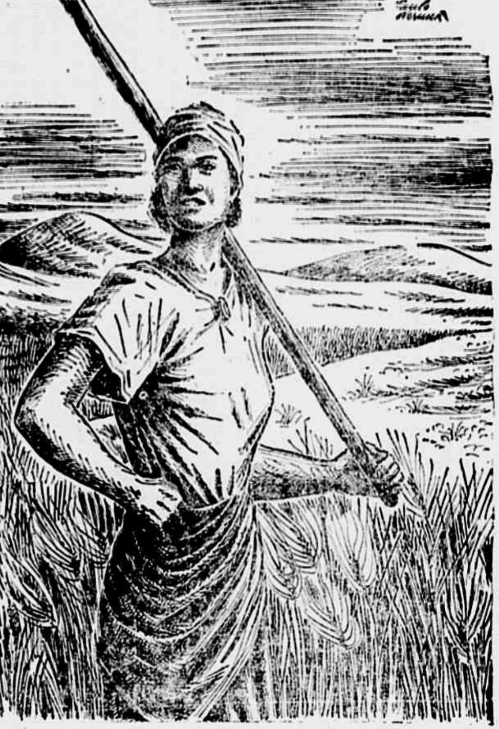
Esta concepção da Europa que ressurge sob o regime democrático popular — é um exemplo de liberdade e liberdade. Diversos países europeus por terem estes novos caminhos são acentos a humanidade.

de união entre as concepções da Europa centro-oriental, desenvolvidas de liberdade e liberdade. Diversos países europeus por terem estes novos caminhos são acentos a humanidade.