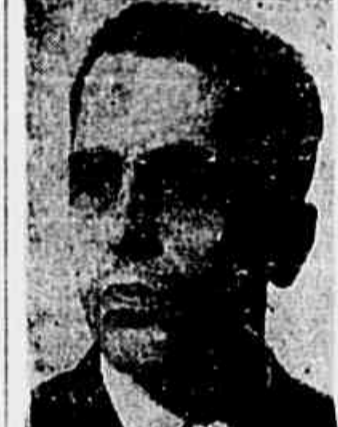
PRESTES em de Almeida Camargo". (Seguem-se centenas de assinaturas).