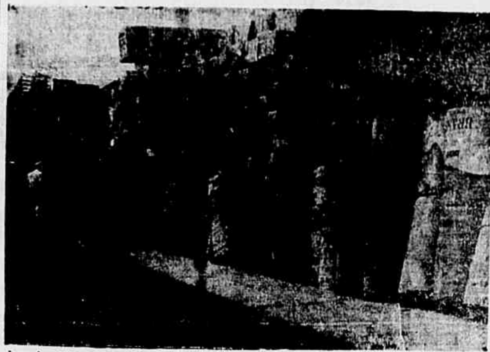
Acumulam-se por toda parte os «stocks» de couros. No pé em que vão as coisas haverá liquidação total da indústria e do comércio nesse ramo. A mercadoria que se destinava ao estrangeiro forma pilhas nos armazéns do país, devido à insensata proibição das exportações

A proibição das exportações reduziu em 70% as vendas — Por falta de crédito desapareceram os compradores para os 30% restantes — Reduzida a produção em cortumes do Rio — Ameaça de total paralização — Na Bahia há cerca de dois mil operários ameaçados de desemprego — Falências e liquidações em perspectivas