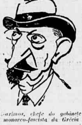
Caricatura, chefe do gabinete monarcho-fascista da Grécia

A ofensiva do governo é apenas de propaganda — Sangue e terror para o povo grego, eis o que significa o «auxílio americano»