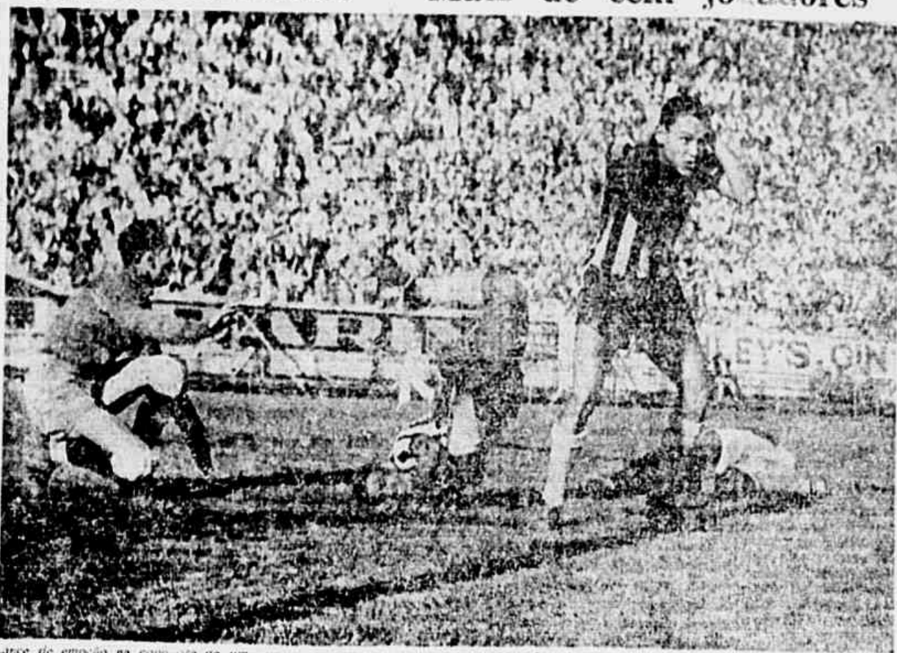
Lance de emoção na conquista de um jogo. A vitória, vencida a recorda, hoje em São Januário, com jogadas idênticas, na disputa do título de mais um Torneio Início

No estádio do Vasco da Gama a F.M.F. realiza hoje a disputa do Torneio Início de Profissionais, arrancada que abrirá as atividades oficiais do certame patrocinado pela entidade carioca. Onze clubes desfilarão aos olhos da torcida numa festa cuja renda caberá às associações dos cronistas esportivos. Cento e vinte e um cracks em ação, gente nova, ainda desconhecida pelo grande público ao lado de cracks famosos e de veteranos ases do mais popular esporte do país. Festa em homenagem