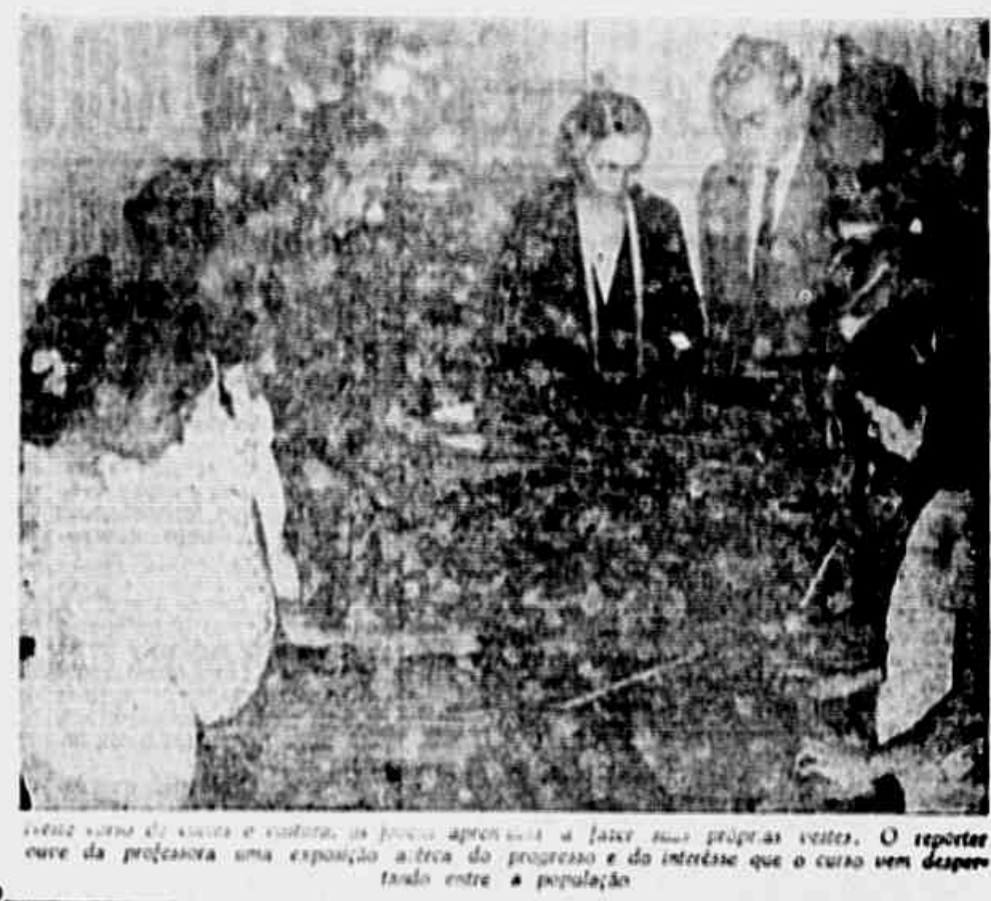
Vem sempre a professora e mostra as coisas aprendidas a fazer suas próprias vestes. O repórter ouve da professora uma exposição acerca do progresso e do interesse que o curso vem despertando entre a população