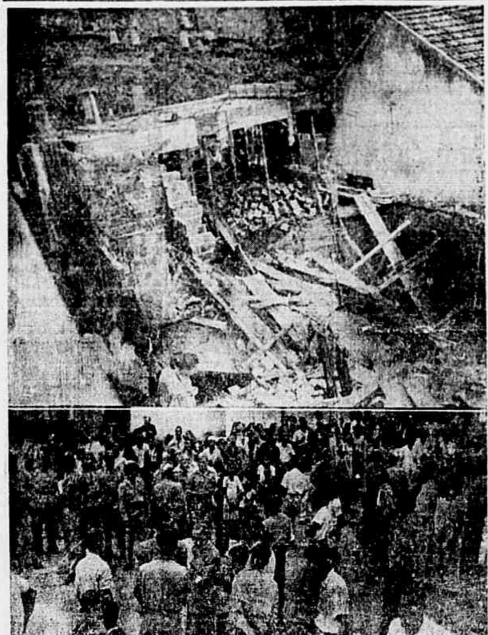
At estio os destroços do prédio e parte da grande multidão que ocorreu no local, vindo-se entre a mesma, corpos do Corpo de Bombeiros que fez o trabalho de socorro dos operários vitimados