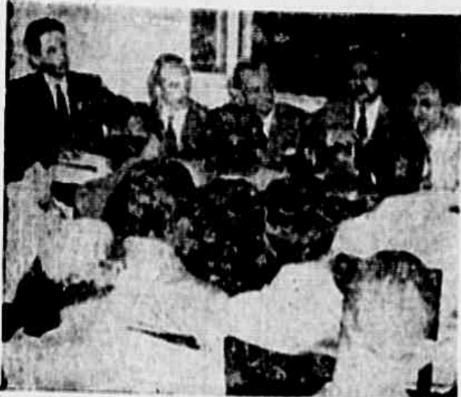
Um grupo de membros do Comite quando palestrava com nossa reportagem

CRESCEM AS FILEIRAS DO COMITÊ DE VIGILANCIA DEMOCRATICO — O THEATRO COMO MEIO DE ORGANIZAÇÃO DO POVO — EDUCAÇÃO E ASSISTENCIA MEDICA — UM VASTO PROGRAMA DE REIVINDICAÇÕES COMO BANDEIRA DE LUTA