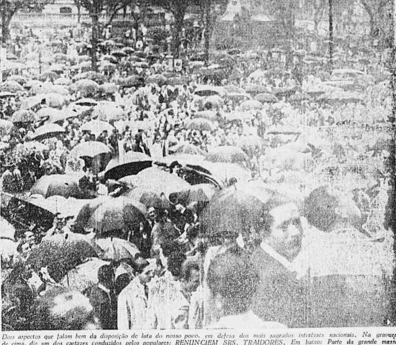
Dois aspectos que falam bem da disposição de luta do nosso povo, em defesa dos mais sagrados interesses nacionais. Na gravura de cima, diz um dos cartazes conduzidos pelos populares: RENUNCIEM SRS. TRAIADORES. Em baixo: Parte da grande massa presente à manifestação, apesar do mau tempo reinante.

NOVAS ADESES DE TRABALHADORES EM ESTALEIROS NAVAIS — CÉRCA DE MIL MINAS DE CARVÃO PARALISADAS PITTSBURG, 26 (U. P.) — Cérca de mil minas de carvão norte-americanas se acham fechadas em consequência da greve de protesto levada a efeito por 225.000 mineiros, eis quanto a Administração Federal dos Minas de Carvão (Conclui na 2.ª pag.)