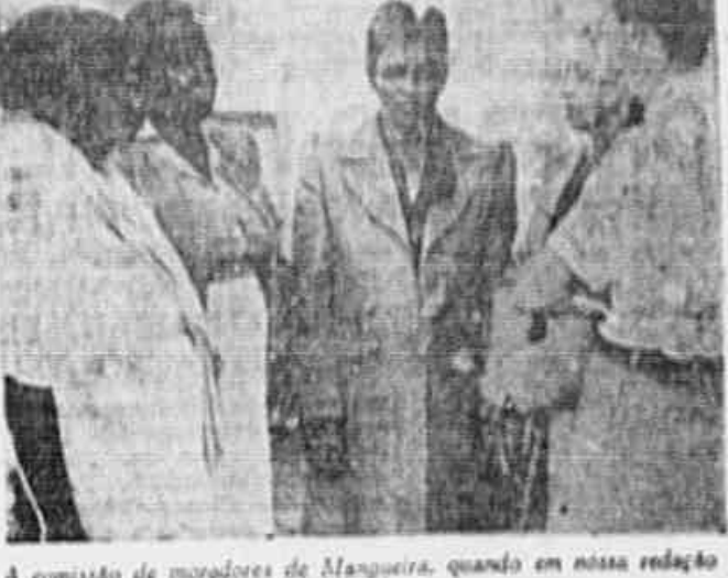
A comissão de moradores de Mangueira, quando em nossa redação.

DR. ARMANDO FERREIRA Clínica Médica — Especialidade: tuberculose e doenças pulmonares, pneumotórax espontâneo. Consultório e residência: — Traversa Manoel Coelho 296 — Tel. 6783 (São Gonçalo) Precisa-se de Oficiais para obra de homem sob medida. Quem não estiver em condições de favor não se apresente. Calçados Vant de Luxo, Rua Buenos Aires, 143-08.