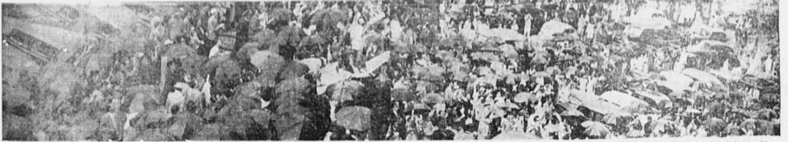
Atendendo ao apelo formulado pelos seus representantes, o povo carioca compareceu em massa ao hasteamento da bandeira a meia-vela, verificando, assim, na Câmara, tendo então oportunidade de demonstrar de forma vigorosa a sua disposição de luta em defesa das liberdades públicas, da Constituição e das prerrogativas do Legislativo da cidade.