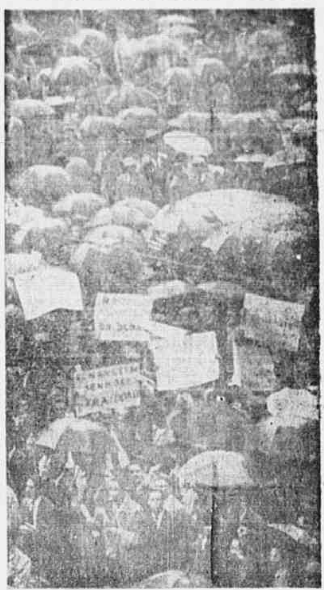
Dois aspectos que falam bem da disposição de luta do nosso povo, em defesa dos mais sagrados interesses nacionais. Na gravura de cima, diz um dos cartazes conduzidos pelos populares: RENUNCIEM SRS. TRAIADORES. Em baixo: Parte da grande massa presente à manifestação, apesar do mau tempo reinante.

OS BATEDORES Nessa altura aproximava-se da praça Floriano o cortejo do presidente do Chile. E, quando, em frente ao Conselho Municipal, já se ouso o ruído dos motores das motocicletas, o povo repetiu com vigor o seu grito de protesto contra a ditadura: "Dutra deve renunciar". O próprio sr. Dutra, que pouco depois passaria, de carro, do outro lado do jardim, em companhia de seu hospede, teria ouvido a voz do povo diretamente se não fosse o barulho das motocicletas de seus batidores. E sentiu diretamente o clamor popular, o grito de renúncia.