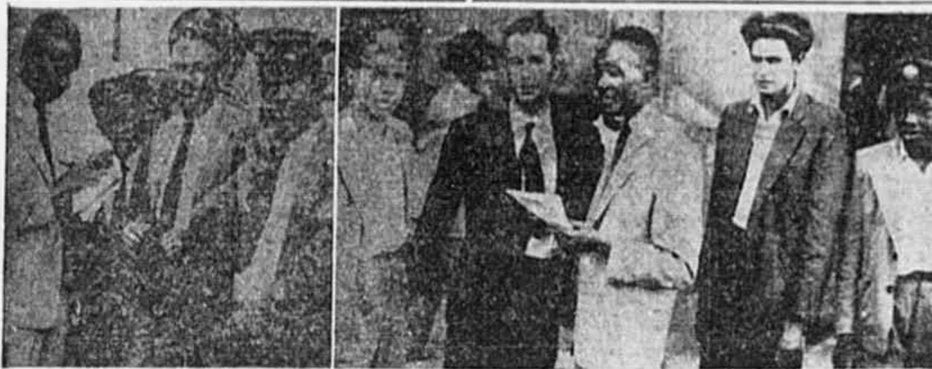
Motoristas e trocadores de ônibus contam à TRIBUNA POPULAR a miséria reinante nas suas casas, pois o que ganham mal chega para não deixar que a família morra à míngua

ANO III * N.º 622 * QUINTA-FEIRA, 12 DE JUNHO DE 1947