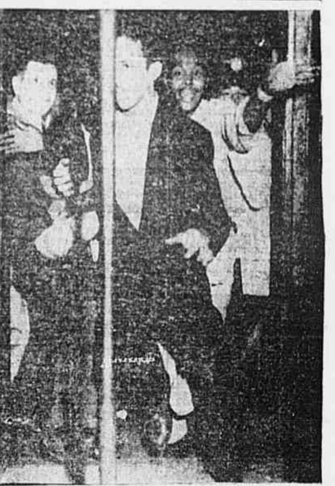
Essa flagrante da "invasão" de um trem elétrico da Central do Brasil que a fotografia acima apresenta, mostra com toda a eloquência o utopismo e a dificuldade que esse minuto constitui para quantos viajam, obrigatoriamente, naquele meio de transporte explorado pelo Governo. Dêta não estão livres as muitas senhoras, crianças e velhos que também viajam, inevitavelmente, nesse trem. Cenas como essa se repetem diariamente, nas horas de grande movimento, e são um triste depoimento das péssimas condições a que está sujeita a maioria da população que trabalha e contribui para o progresso do Brasil que meia dúzia de aventureiros procura malbaratar. Pois bem, problemas como esse poderiam ser resolvidos facilmente por qualquer administração honesta. Os homens da ditadura, porém, não estão empenhados em defender o bem-estar e o conforto do povo e sim tomar medidas que tornem a vida cada vez mais insuportável, arrastando o país para o desastre econômico em benefício de meia dúzia de abutres e dos banqueiros estrangeiros. (Reportagem na 6.ª página)

No mês de abril, a receita bruta da aludida empresa elevou-se a 7.635.245 dólares, e a despesa, atingiu a 5.447.089, enquanto no mês de maio do ano passado essas importâncias eram respectivamente de 5.747.070 e 3.966.322 dólares.