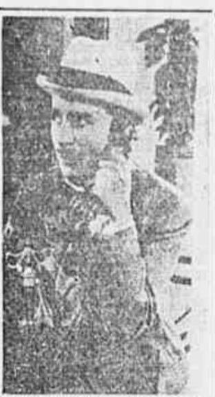
Charles Chaplin, artista querido e admirado em todo o mundo

«SÓ A ACEITAÇÃO DO PROJETO DA BANCADA COMUNISTA MAJORANDO EM 100% OS ATUAIS SALÁRIOS MÍNIMOS PODE MINORAR A SITUAÇÃO DOS TRABALHADORES» — GANHAM APENAS O BASTANTE PARA NÃO DEIXAR A FAMÍLIA