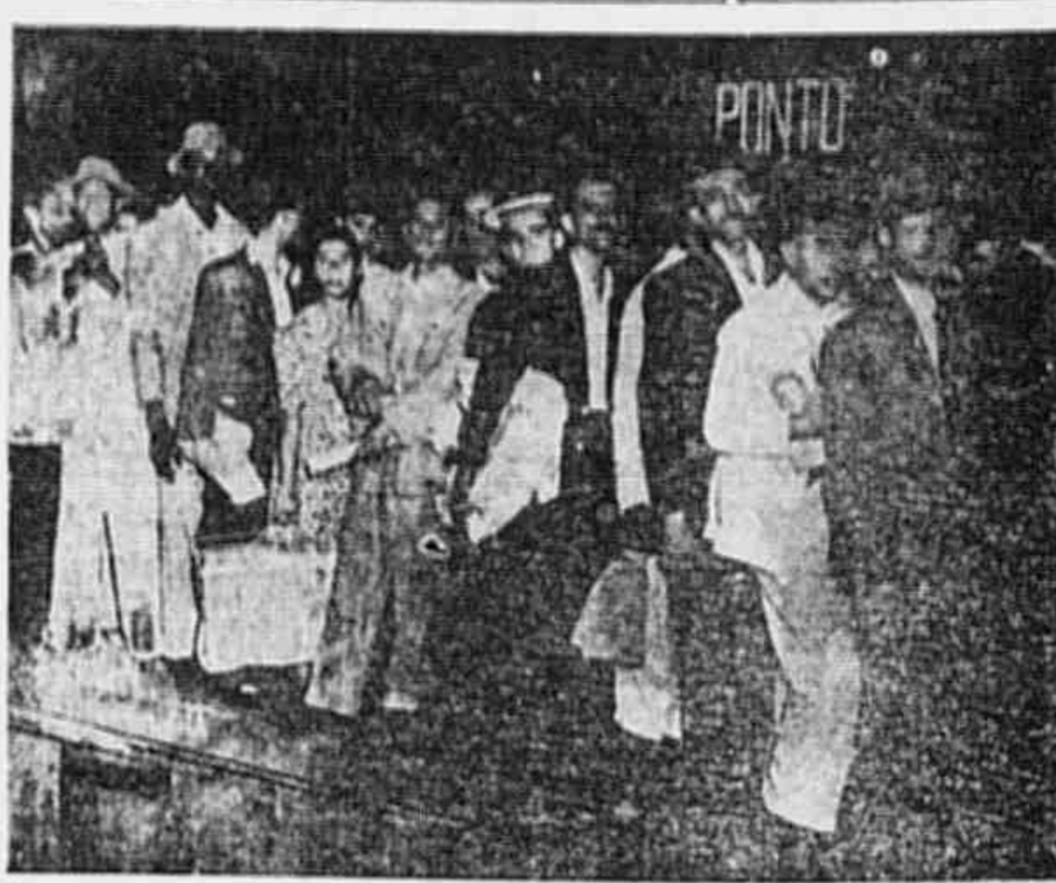
Vista assim, de uma plataforma vazia, o interior da gare da Central parece dar uma idéia de ordem, de filas bem arrumadas...

ANO III * N.º 622 * QUINTA-FEIRA, 12 DE JUNHO DE 1947