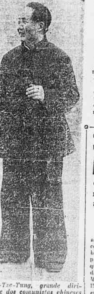
Mao-Tse-Tung, grande dirigente dos comunistas chineses