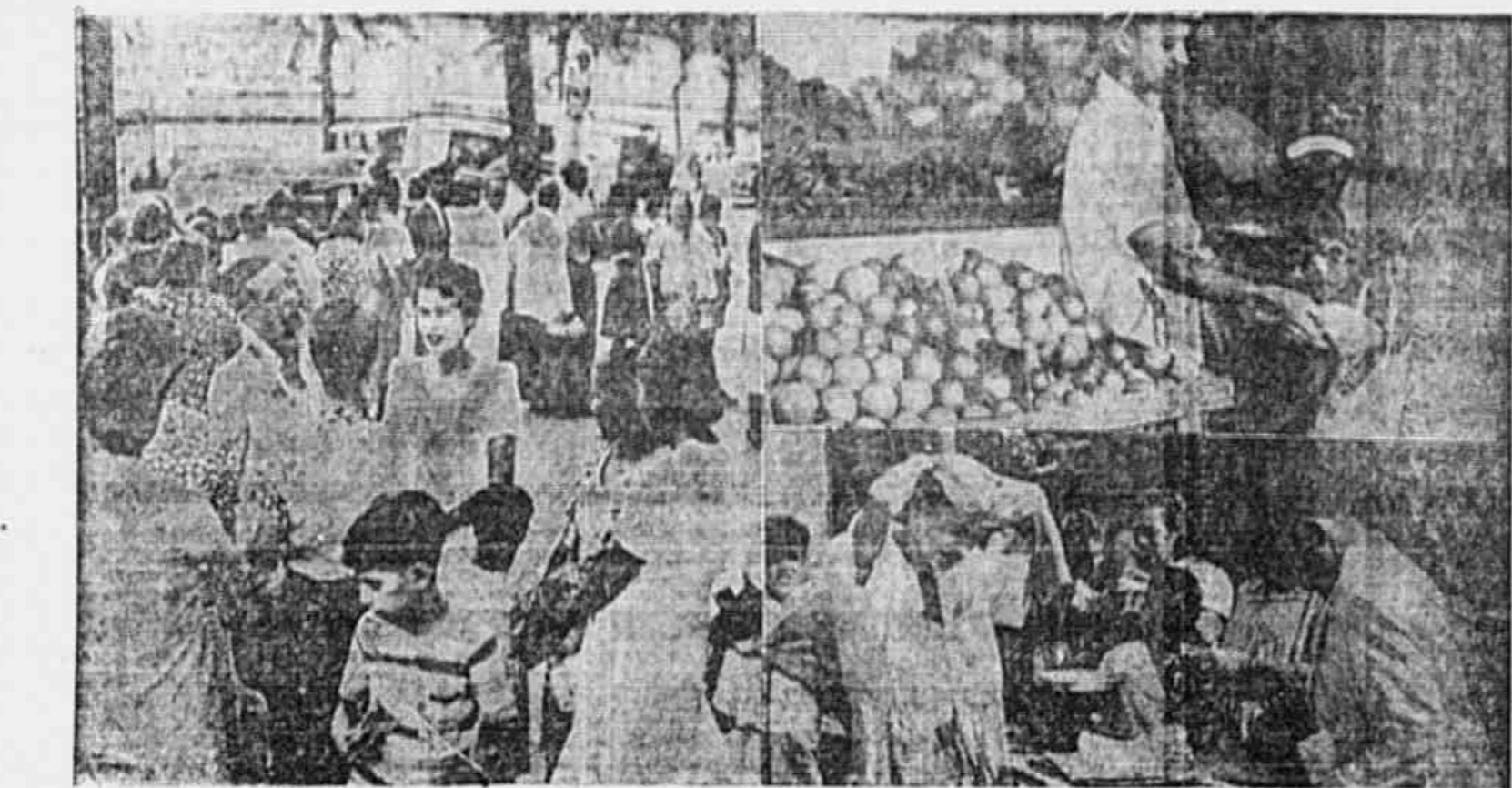
Quando os gêneros aumentam de preço e o povo sofre nas feiras livres, o ditador Dutra não encontra soluções para nossos problemas.

Embora a situação econômica esteja melhorando, a administração do ditador Dutra não encontra soluções para nossos problemas. As estatísticas oficiais mostram que a inflação continua a subir, e a vida continua a ser difícil. Isso tem afetado especialmente as famílias de baixa renda, que não têm como pagar os preços altos.