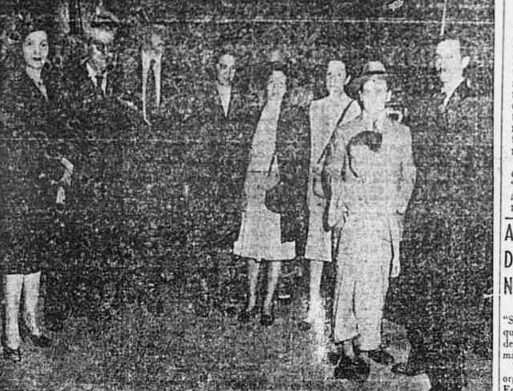
PORTINARI, o genial pintor brasileiro, partiu ontem para Buenos Aires, onde vai realizar uma exposição dos seus quadros...