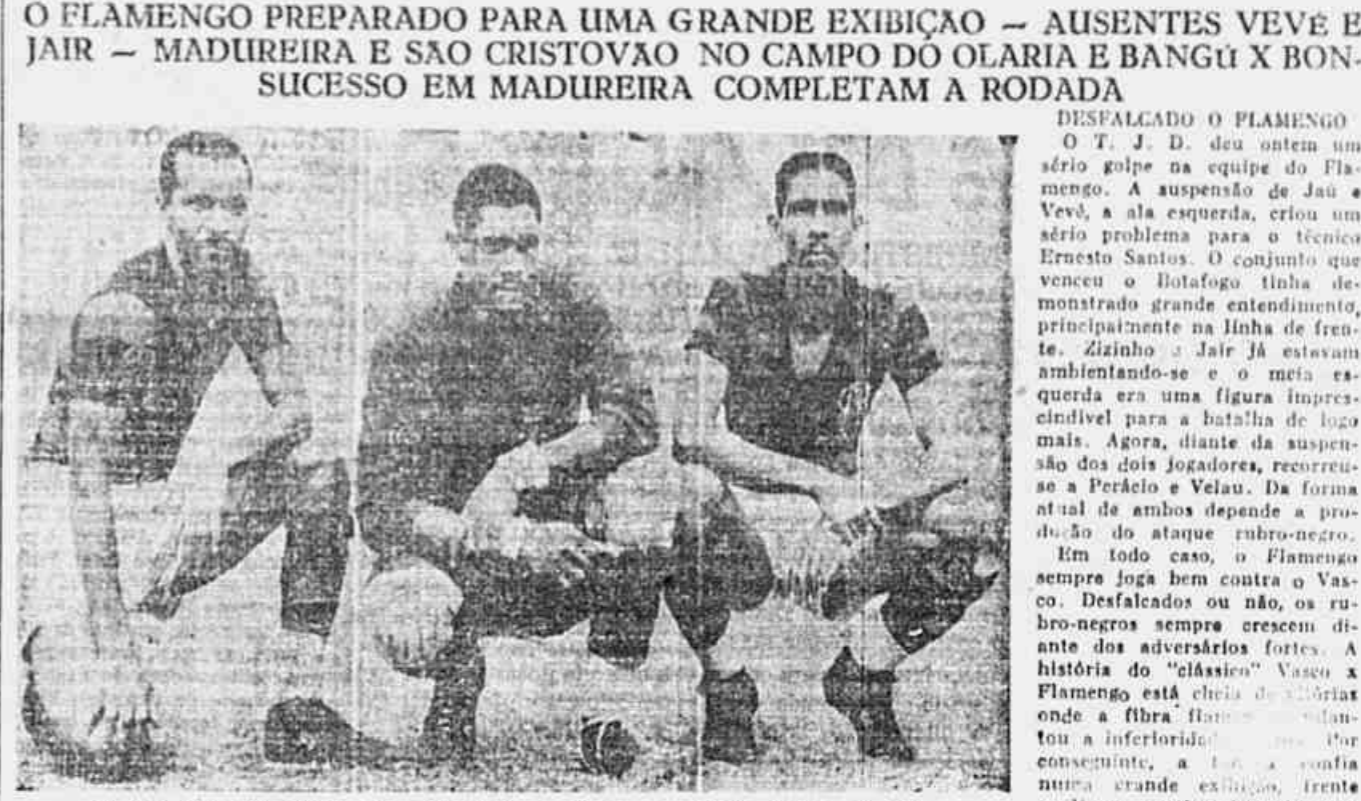
O trio final rubro-negro que enfrentará o Vasco na grande batalha de hoje