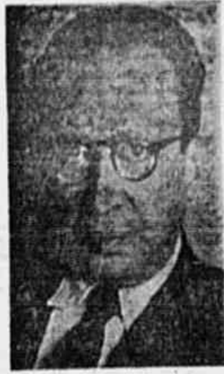
Escritor Manoel Bandeira

Com o pronunciamento do T.S.E., o Brasil é a primeira das Nações Unidas que abjura de seus propósitos democráticos — A palavra do professor Artur Ramos e dos escritores Manoel Bandeira e Guilherme Figueiredo