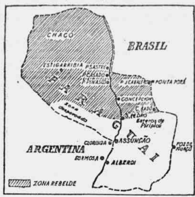
No mapa que acima se vê, do Paraguai, a zona já liberada pelos revolucionários, está coberta de traços.

O plano dos revolucionários, quando pôsto em execução, consumirá em poucos dias a resistência de Morinigo. Reportagem de EGYDIO SQUEFF