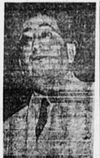
Prof. Artur Ramos

diversos intelectuais e professores, todos aderidos em que tal fato veio despojar a Nação e golpear a Democracia. A DEMOCRACIA FOI MUTILADA. Infortunadamente, a nossa imprensa, o dr. Artur Ramos, médico e professor de antropologia, autor de vários livros especializados que firmaram o seu nome como uma das maiores autoridades naquela ciência. Disse-nos: