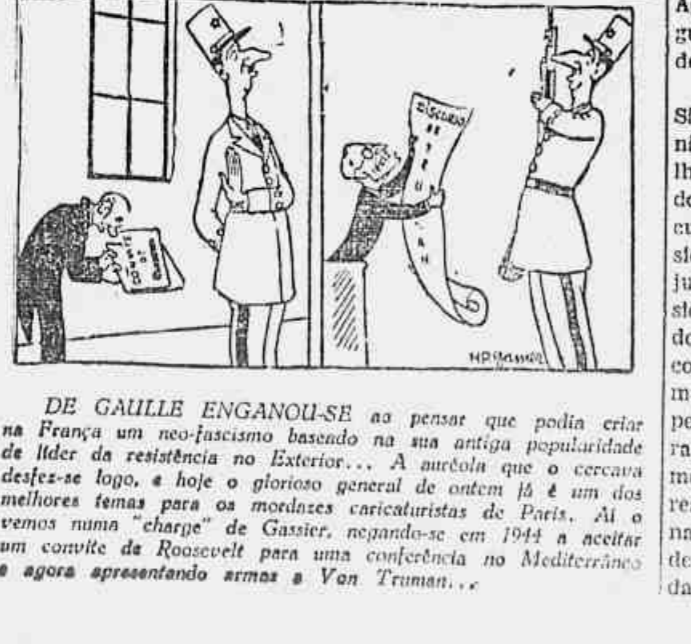
DE GAULLE ENGANOU-SE em pensar que podia criar na França um neo-fascismo baseado na sua antiga popularidade de líder da resistência no Exterior... A nuclon que o cercava melhorava suas chances de vitória em 1944 e não em 1945. Agora, com os molinés caricaturistas de Paris, ali o comitê de Roosevelt para uma conferência no Mediterrâneo e agora apresentando armas a Von Trum...