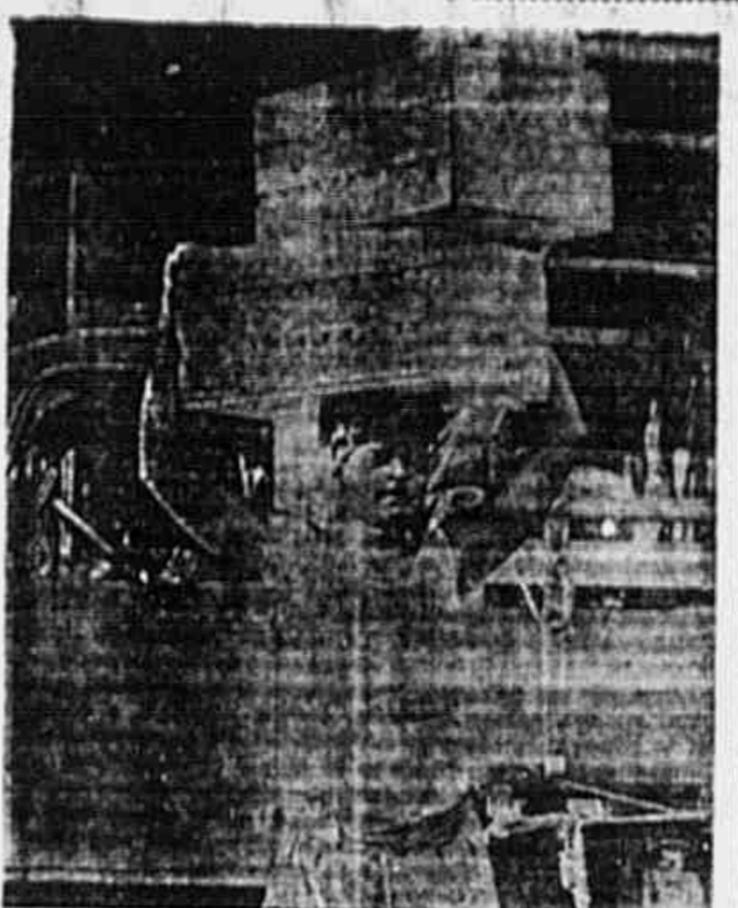
Segundo nos informaram, o tomate sofreu uma grande baixa. Chegou a falta e já estão chegando maiores quantidades ao Mercado. Subentende-se uma baixa custava Cr$ 370,00 e ontem já baixara para Cr$ 250,00.

COMICIO OPERARIO DE PROTESTO, EM HAMBURGO — HAMBURGO, 9 (A. P.) — Uma multidão calculada em mais de 100 mil pessoas, se reuniu na praça fronteira à sede da Federação dos Sindicatos desta cidade, para protestar contra o racionamento de alimentos. Todos os operários, com exceção dos empregados em serviços essenciais, encerraram as suas atividades ao meio dia para comparecer ao comício, descrito por líderes da Federação como o maior já realizado na zona britânica de ocupação desde o fim da guerra.