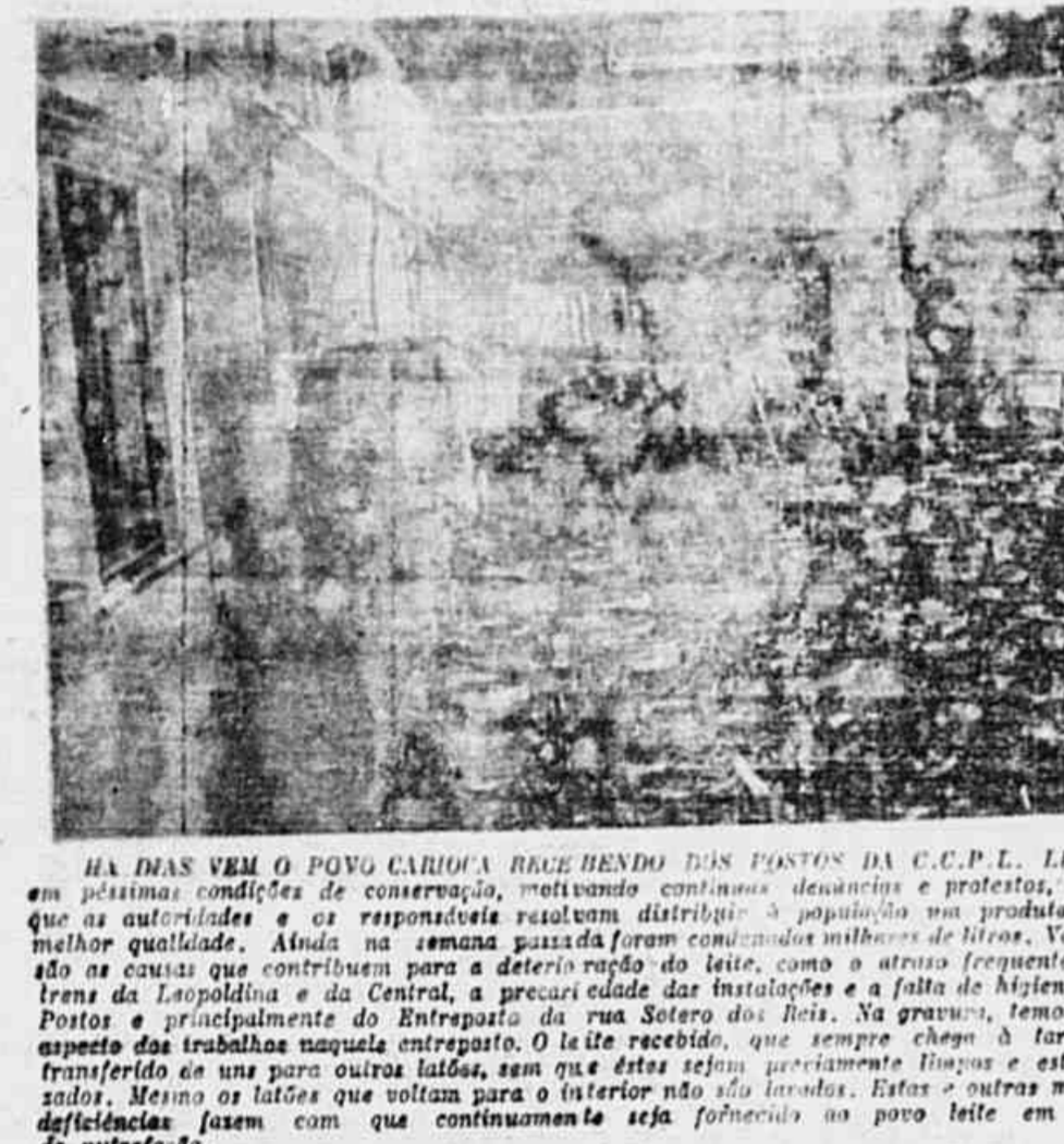
HA DIAS VEM O POVO CARIOCA RECEBENDO DOS POSTOS DA C.C.P.L. LITE em péssimas condições de conservação, motivando contínuas denúncias e protestos, sem que as autoridades e os responsáveis tenham tomado qualquer medida para melhor qualidade. Ainda na semana passada foram convidados milhares de alunos de todas as escolas para receberem os livros, porém, em vez disso, foram recebidos os livros em péssimas condições de conservação, motivando contínuas denúncias e protestos, sem que as autoridades e os responsáveis tenham tomado qualquer medida para melhor qualidade. Ainda na semana passada foram convidados milhares de alunos de todas as escolas para receberem os livros, porém, em vez disso, foram recebidos os livros em péssimas condições de conservação...