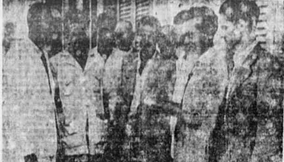
OS MARMONISTAS FORAM GRANDEMENTE PREJUDICADOS com a recente decisão da Justiça do Trabalho, concedendo-lhes apenas 50 % de aumento nos salários...

Os trabalhadores, em suas organizações... defendem a indústria nacional contra a ofensiva econômica do imperialismo yanque.