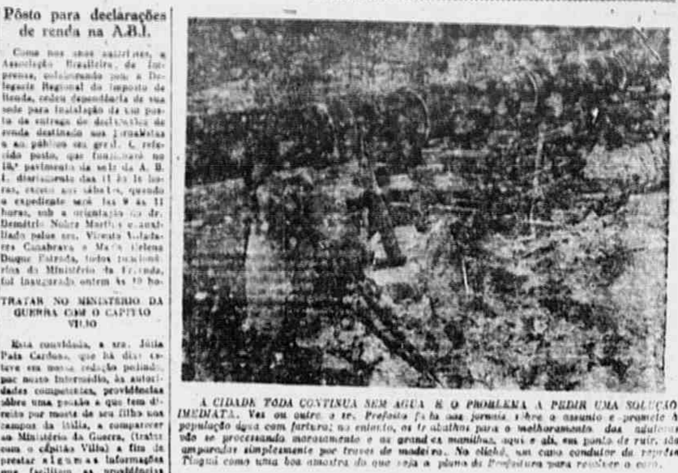
A CIDADANIA TODA CONTINUA SEM AGUA E O PROBLEMA A PEDIR UMA SOLUÇÃO Imediata. Vas ou outro a ser. Proposta foi a sua solução. A obra é assunto e promete a população água com fartura; no entanto, os trabalhos para o melhoramento das águas vão se processando marcadamente e as grandes mangueiras, aqui e ali, em ponto de ruir, são apuradas simplesmente por trocas de mangueiras. No nicho, um curso condutor de água Plágio como uma boa mostra do que seja a planta da Prefeitura para resolver o problema.