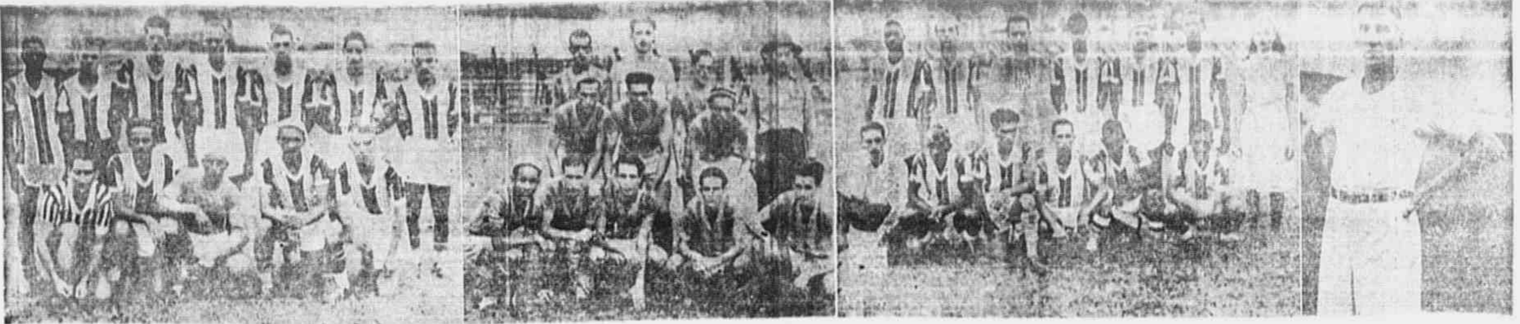
O "CAMPEONATO POPULAR" CONTINUA EM POLGANDO OS TORCEDORES CARIOCAS. O GRANDE CERTAME QUE A TRIBUNA POPULAR ESTÁ REALIZANDO COM ABSOLUTO ÊXITO, movimento domingo último um número grande de assistentes, que apreciaram as jogadas técnicas dos "cracks" no gramado do Bonfret. As gravuras que aparecem aqui, da esquerda para a direita, mostram os quadros do Independente, Unidos da Glória, Tomba S.C. e o juiz Cristiano, participantes da tarde esportiva. (Incluído na 7.ª página)