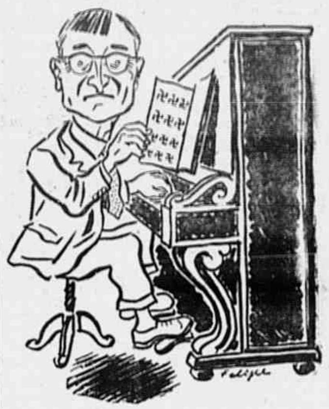
O ÚLTIMO «FOX» DE WALL STREET