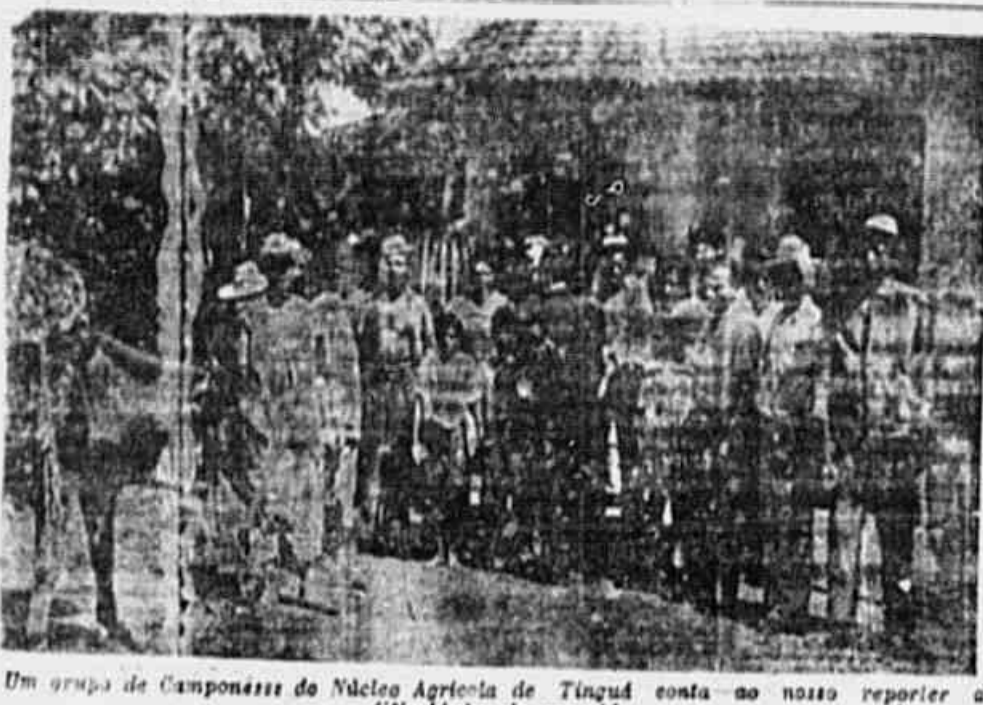
Um grupo de Camponeses do Núcleo Agrícola de Tinguá conta ao nosso repórter as dificuldades de sua vida