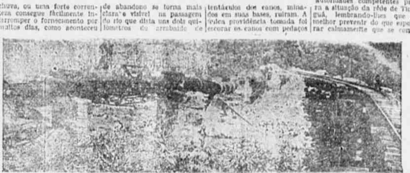
No Rio que dista 2 quilômetros do arrabalde de Tinguá, vemos a situação do tubo condutor de água ameaçado de ruir a qualquer momento. À menor enchente que se verificar, também a ponte da Estrada de Ferro corre o mesmo perigo, sem que a menor providência fosse tomada.

AS ÚLTIMAS ENCHENTES CAVARAM O LEITO DO RIO DESTRUINDO AS PILASTRAS QUE SUSTENTAM O ENCANAMENTO — NENHUMA PROVIDÊNCIA FOI TOMADA PELA REPARTIÇÃO COMPETENTE