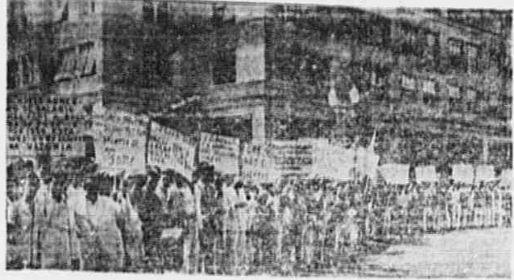
MARCELENOS, EMPENHADO DISTICOS E FARTAZES, na ocasião em que aguardavam a julgamento do dissídio coletivo, em que lhes foi concedido uma redução de 10% nos salários...