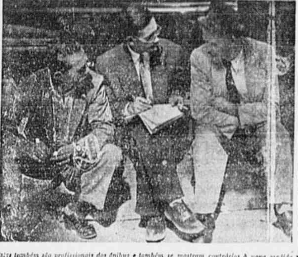
Esta também são profissionais dos ônibus e também se mostram contrários à nova medida...