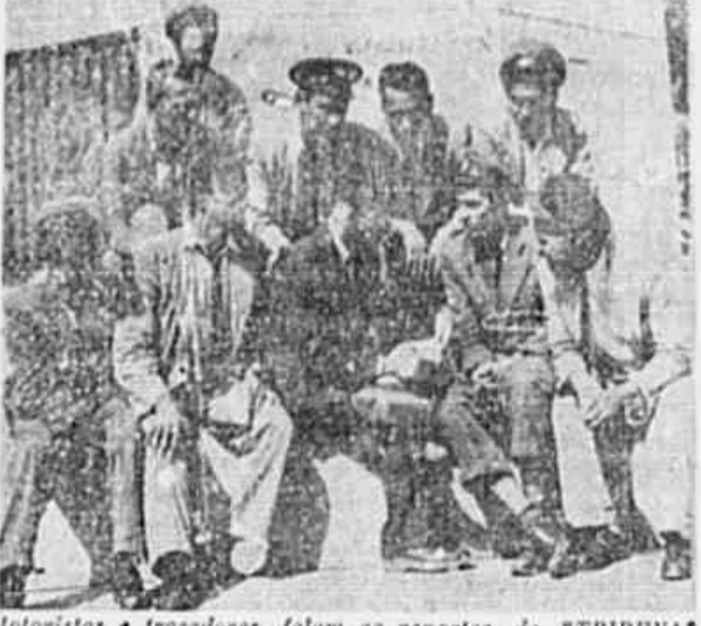
Motoristas e trocadores falam ao reporter da "TRIBUNA"...