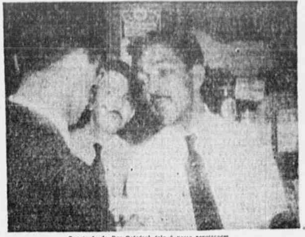
O gerente do Bar Catedral fala à nossa reportagem