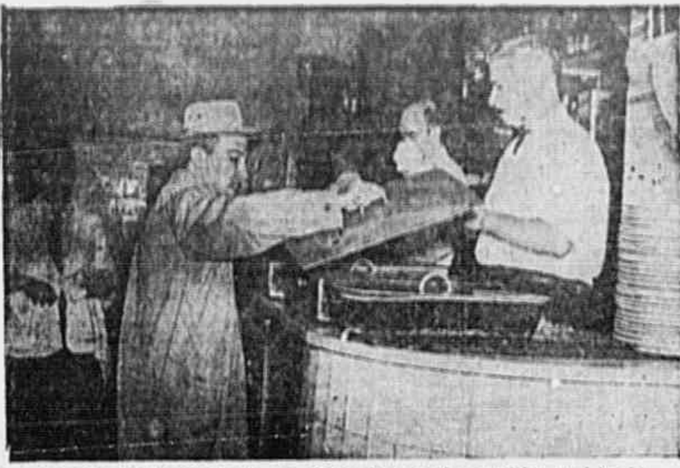
O repórter examina os pratos da casa, observando as panelas encardidas e mal lavadas