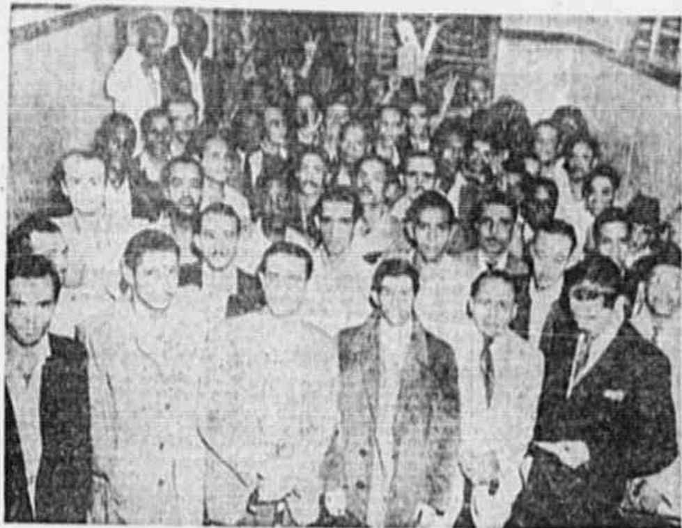
Os trabalhadores da Light, em nossa redação

Lutarão pelo cumprimento do repouso remunerado, pela readmissão dos companheiros demitidos e demais direitos assegurados pela Constituição — Os operários de Carris Urbanos protestam contra a proibição de reunião em seu Sindicato