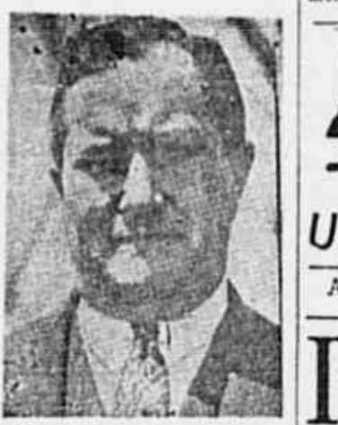
Mr. Braden, famoso agente imperialista

Este é o sentido das palavras pronunciadas, ante-ontem, em Washington, por dois conhecidos políticos lanques. Mr. William Benton, secretário adjunto de Estado, e seu antecessor no cargo, ex-embaixador na Argentina, Mr. Spruille Braden. No discurso de ambos surge a tese fascista de que a União Soviética e o comunismo são os grandes inimigos, e em ambos a veemência de linguagem etecando uma completa falta de argumentos. Mr. Benton, por exemplo, confundindo a exportação de idéias e credos políticos com a do Coca-Cola ou uma bugiganga qualquer de fabricação americana, que se impõe nos mercados à custa de publicidade, qualquer que seja o seu valor, declara que os partidos comunistas organizados em todo o mundo são "os mais eficazes instrumentos" para a propagação russa.