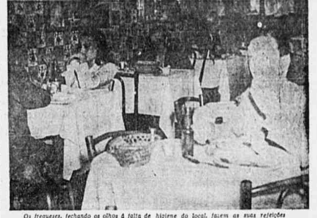
Os fregueses, fechando os olhos á falta de higiene do local, fazem as suas refeições

comem ali na praça da República, informam que as privadas vivem permanentemente mal cuidadas. E' PRECISO MAIS LIMPEZA. Realmente, sob este aspecto, tanto os bares como os restaurantes precisam de maior fiscalização. As autoridades competentes devem, pois, tomar providencias, a fim de que a situação não se torne pior. De fato, é preciso ter muito bom estomago para se comer numa dessas casas. E, cremos, a sua resolução não é nada difícil e nem