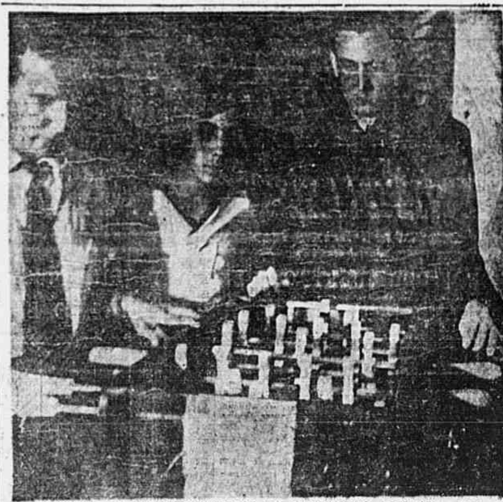
FUTEBOL DE MESA PARA O VENCEDOR DO "CAMPEONATO POPULAR" — Mais um prêmio para o vencedor do "Campeonato Popular". Desta vez o oferecimento partiu de um "fan" do esporte independente e grande animador de todas as iniciativas de caráter esportivo.

LIHS F. C. A diretoria convidou os socios e adeptos do clube para assistir ao encontro de hoje com o Atlas. O jogo será realizado às 13:30 no campo do adversario, a rua Heracleito Graça n.º 20.