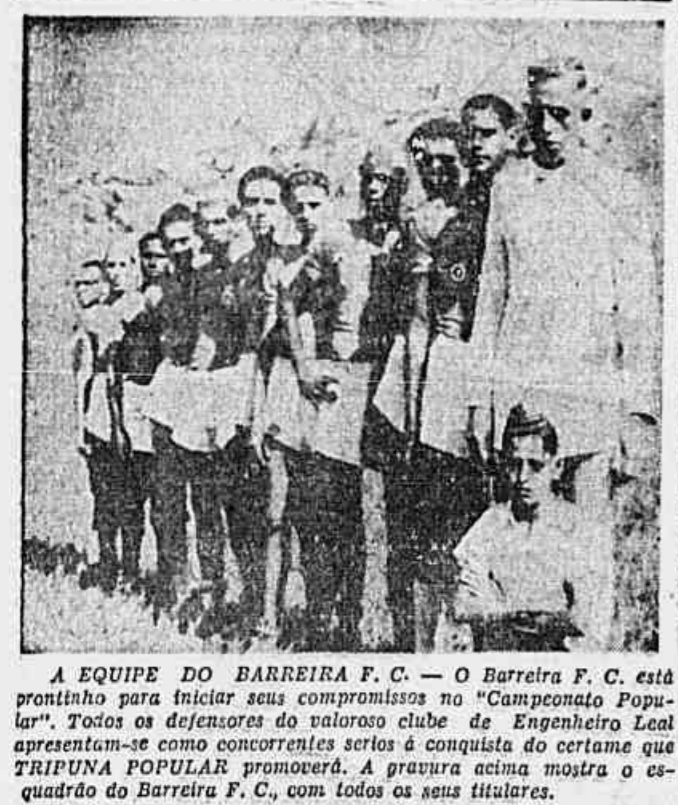
A EQUIPE DO BARREIRA F. C. — O Barreira F. C. está pronto para iniciar seus compromissos no "Campeonato Popular".