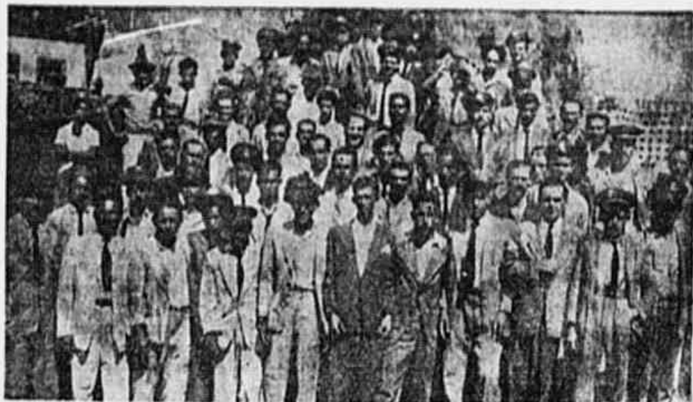
Motoristas e trocadores de onibus, após o julgamento do dissídio, aglomerados em frente ao edifício onde funciona a TRIBUNA POPULAR