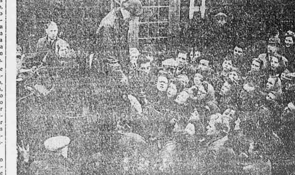
OS LONDRESINOS SITIAM UM ARMAZÉM DE CARVÃO — Com o re-estabelecimento de alguns transportes na Inglaterra e com os suprimentos de carvão novamente entrando em Londres, o povo, que normalmente esperava que o carvão lhe fosse entregue a domicílio na distribuição em caminhões, esgotou a paciência e invadiu os depósitos...