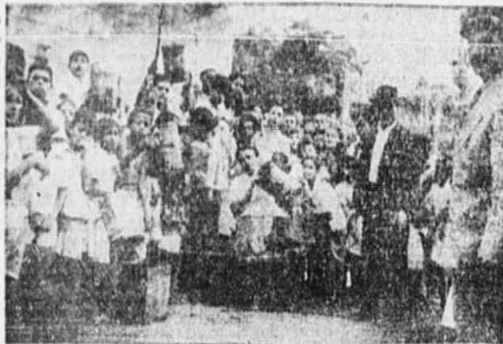
A fila que se forma em torno da cozinha, localizada junto de uma sargeta enfiteusica

JM SUBURBIO ESQUECIDO PELA PREFEITURA — QUE O BONDE "PIEDADE VA' ATE' CASCADURA — DOMINGO, NA ASSOCIAÇÃO DEMOCRÁTICA DO BAIRRO FALARAO CANDIDATOS DA CHAPA POPULAR