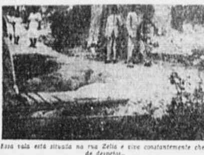
Essa via está situada na rua Zelia e vive constantemente cheia de despejos.

De um lado ou do outro da ponte, ainda, um calanço que faz a vida dos moradores de Cascadura e de outros bairros, e, por fim, em Cascadura os problemas de transporte e de água, e os operários da Central do Brasil, a fim de chegar a tempo e com a segurança para a sua subestação, onde para chegar na hora certa ao trabalho em uma repartição. Avião, trem, ônibus, e outros meios de transporte, a maioria de Cascadura e de outros bairros, e os operários da Central do Brasil, a fim de chegar a tempo e com a segurança para a sua subestação, onde para chegar na hora certa ao trabalho em uma repartição.