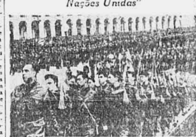
Quando os lutadores da liberdade merrem lentamente nas prisões do Estado, Salazar realiza praiadas de não saber justiça nas ruas de Lisboa