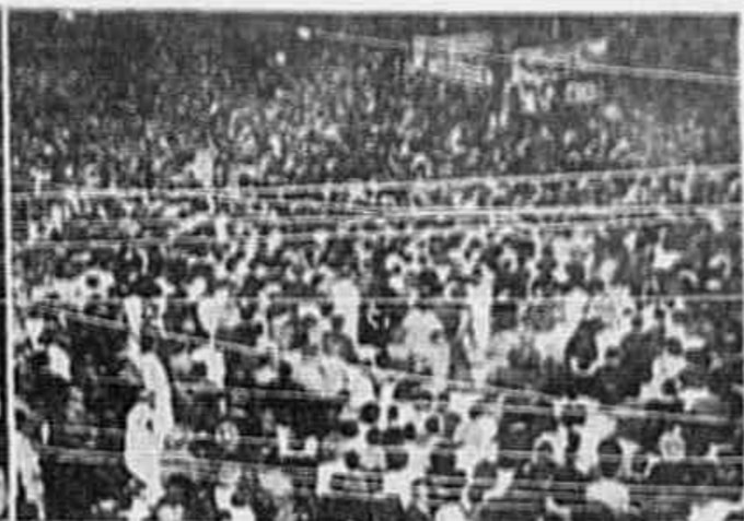
Pedro Pomar, cuja candidatura a deputado federal será sufragada pelas massas paulistas no pleito de 19 de janeiro. As fotografias acima, tomadas na cidade de São José do Rio Preto, dão uma idéia nítida do entusiasmo político do povo daquela localidade, que é o mesmo em todo o interior paulista, diante da palavra jamais traída dos verdadeiros líderes po-