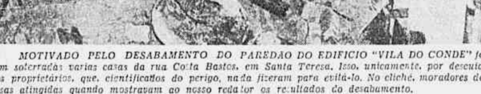
MOTIVADO PELO DESABAMENTO DO PAREDAO DO EDIFICIO "VILA DO CONDE" foram soliciadas varias casas da rua Costa Bastos, em Santa Tereza, Isero, unicamente por descuido dos proprietários, que, entediados com o perigo, nada fizeram para evitá-lo. No clichê, moradores das casas atingidas quando mostravam ao nosso redator os resultados do desabamento.