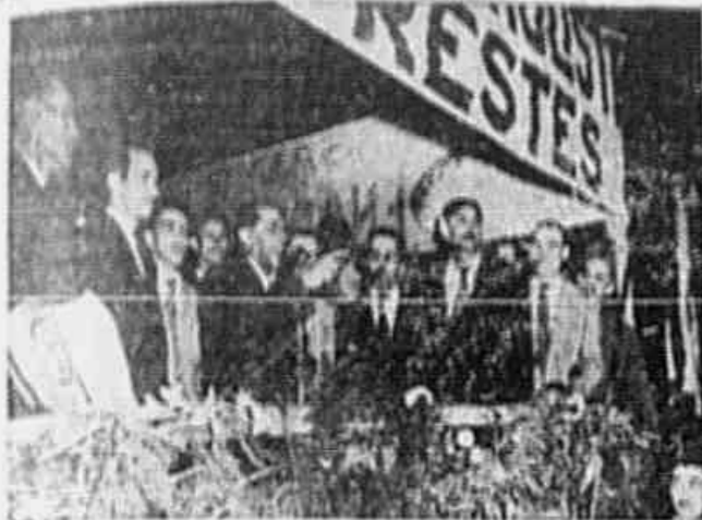
PROSEGUE COM O MAIOR EXITO E VIBRAÇÃO A CAMPANHA ELEITORAL DO PARTIDO COMUNISTA EM SÃO PAULO — Desenhas de milhares de pessoas reúnem-se nos logradouros públicos das diversas cidades paulistas que têm recebido a visita de Prestes, para ouvir e aplaudir a palavra do grande líder popular, assim como a do nosso diretor