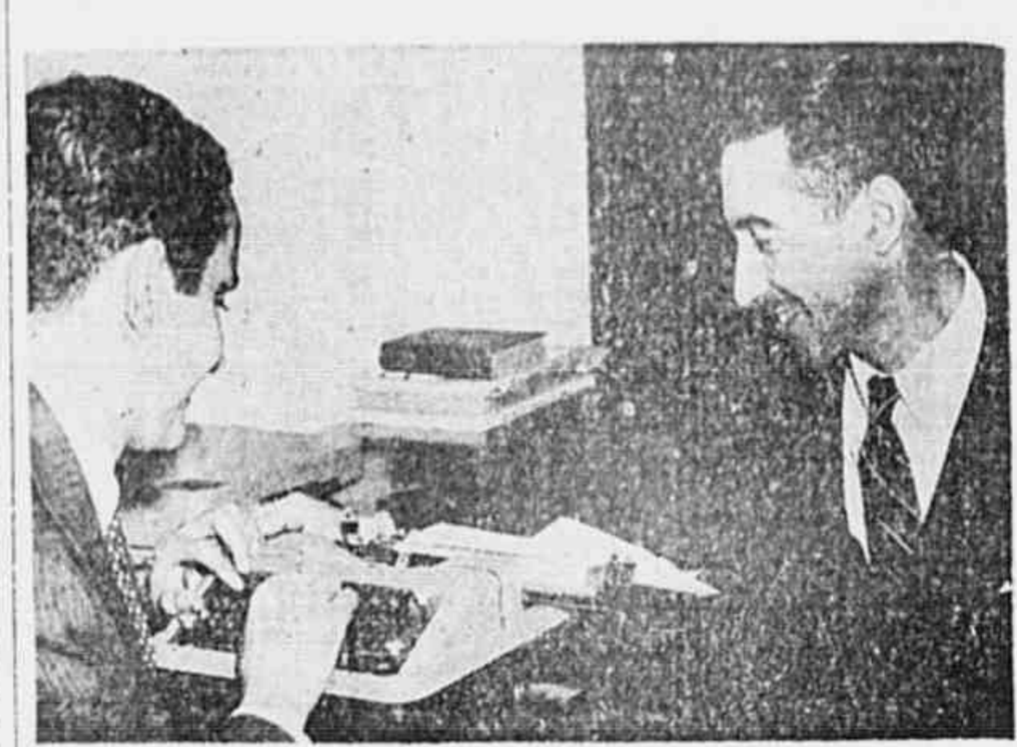
O herói anti-fascista Apolônio de Carvalho, revolucionário de 1935, capitão de artilharia na guerra civil da Espanha e tenente-coronel da Resistência Francesa, quando lutava a nossa libertação.

maia radical contra o governo de Franco. Eles foram como satélites quando o homem de Caxias, como a da liberdade e os líderes de muitos dos movimentos libertários. A Espanha — os como um foco de atração para a paz e os outros da unidade interna devem redobrar sua luta contra o terror franquista.