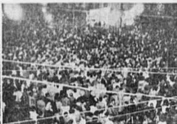
pulares. Acontecimento novo e significativo, que uma das fotos ilustra, é o desfile das delegações camponesas, dos trabalhadores rurais que agora despartam e marcham, guiados pelo Partido Comunista, para a conquista de um Brasil mais progressista e mais democrático. A excursão empreendida por Prestes e diversos candidatos da Chapa Popular pelas zo-