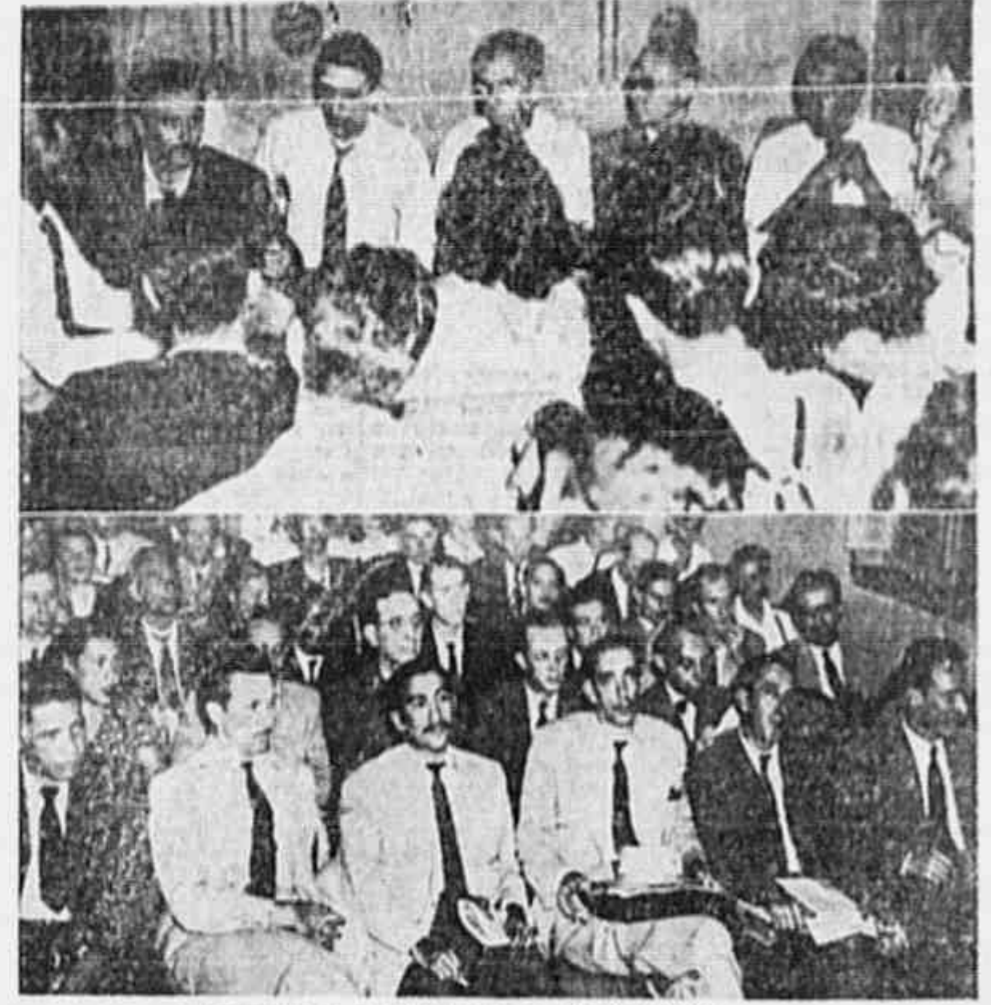
Outros aspectos da reunião plenária no Distrito Central

Convocação Pedem-nos a publicação da seguinte: O Comitê Nacional do P. C. B. convoca para uma reunião, hoje, às 11 horas, a rua da Glória n. 25, os secretários das seguintes células: José Ribeiro Filho, 22 de Maio, Antero Viana, Marinha Berger, 9 de Março e Cipriano Barata.