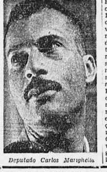
Deputado Carlos Marighella