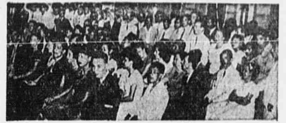
Um aspecto da reunião em que foi instalado o Departamento Juvenil da USTDF