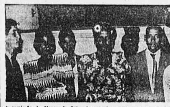
A comissão do Morro do Salgueiro, vindo-se no visita os candidatos a cidadão e embaixatriz do samba, em 1947

ha de 1947. Oportunidade como esta raramente surge diante do povo do morro. Estou me preparando para o dia 2 de Janeiro, quando terei de exibir as minhas qualidades de sambista e porta bandeira. Criei ser eleito juntamente com o meu parceiro elevando ainda mais, o prestigio do Morro do Salgueiro na União Geral das Escolas de Samba. Sou candidata das três escolas do morro: "Depois eu Digo", "Unidos do Salgueiro" e "Azul e Branco". Espero também grande votação