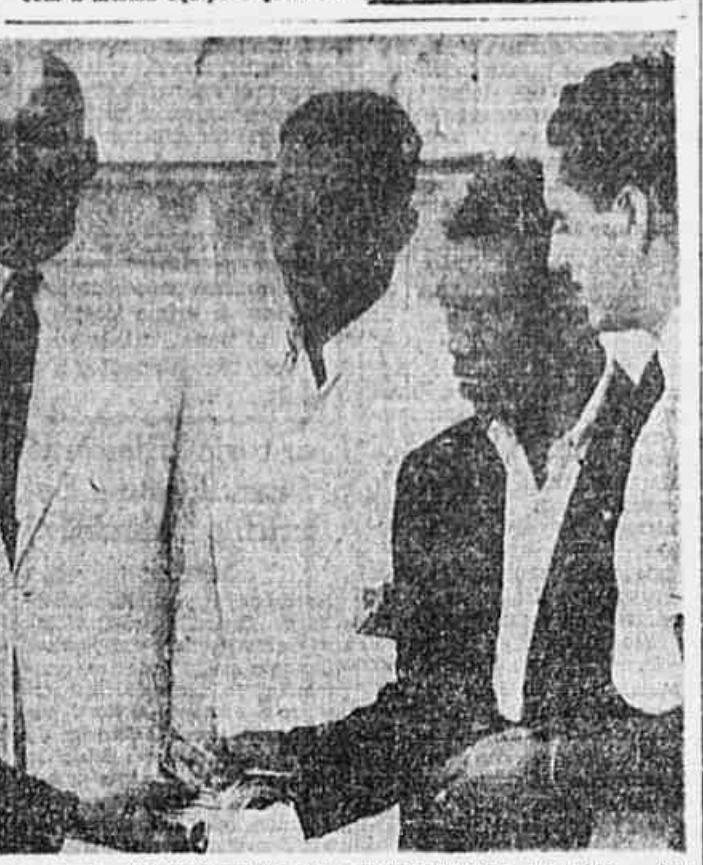
DEMITIDO POR LUTAR PELO CUMPRIMENTO DA CONSTITUIÇÃO DE 1946 - Numerosa comissão de electricistas e bombeiros hidráulicos, empregados da firma construtora Cavalcanti Junqueira S. A. esteve, ontem, em nossa redacção...

Inicia-se hoje a disputa do Torneo para decisão final do título de campeão carioca em 1946. Por coincidência o sorteio da tabela de jogos indicou para a abertura justamente os mesmos adversários que se bateram na rodada final do certame.