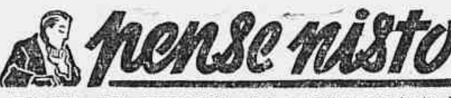
LEITURA DOS FOLHETOS DEMOCRÁTICOS — Uma das necessidades para todo democrata é a leitura dos folhetos que ensinam a melhor maneira de lutar pela democracia e esclarecer a respeito do que é luta de classe, socialismo, comunismo, o que é imperialismo, etc. Mas não basta ler, apenas, como se lê uma revista ou um jornal. Devemos ler, meditar sobre um trecho de leitura, consultar amigos a respeito de outros trechos que não entendemos bem durante a leitura. Ler pela rama é um erro que leva não somente a ter uma visão incorrecta dos problemas como a não ter uma convicção profunda do que quer e do que precisa para formar uma verdadeira consciência política. Uma pessoa que lê mal, não sabe bem o que quer. Ler os discursos de Prestes, de outros discursos de Prestes, não é como um curso de política prática, de esclarecimento diário. Seus discursos não são como os milhares de discursos dos políticos liberais e reacionários. São feitos numa base científica, depois que as questões foram analisadas a frio e depois que a experiência deu a última palavra sobre o assunto de que se trata. Eis porque é indispensável a leitura constante dos discursos de Prestes. Este trecho final, por exemplo, do discurso de São Januário está tão atual que merece ser relido para mostrar o quanto Prestes vai a fundo dos problemas e vê muito longe como um verdadeiro marxista que é um mestre de ciência política. Eis-lo:

O diretor do Departamento de Fiscalização da Prefeitura deu ontem entrevista a um representante, anunciando as medidas que serão adotadas em relação à propaganda escrita nas vias públicas. Referiu-se aquela autoridade municipal ao que é proibido e ao que não o é, tudo em momento oportuno, visto que nos encontramos às portas de intensa campanha eleitoral e muitos equívocos foram cometidos pela Prefeitura, nos últimos tempos, nessa matéria. Assim, é que será livre, como é natural, a colocação de cartazes e painéis nas vias públicas, havendo tolerância das autoridades em relação à colocação de faixas, para que os partidos possam fazer melhor e mais intensa propaganda. Ficam agora os partidos, organizações políticas e pessoas sabendo o que podem e o que não podem fazer.