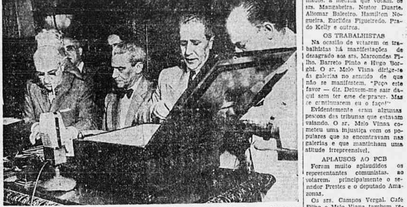
A mesa quando fazia a apuração dos votos para a eleição do Vice-Presidente da República

Mais uma sessão de grande importância realizou-se ontem no Palácio Tiradentes. Tratava-se da eleição do vice-presidente da República. Pelas Disposições Transitórias da Constituição o vice-presidente eleito poderia tomar posse ontem mesmo, perante a Assembleia Constituinte, ou no Senado, depois de ditado o Parlamento em duas Casas.