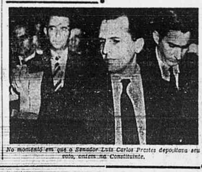
No momento em que o Senador Luiz Carlos Prestes depositava seu voto, ontem na Constituinte.

delegados congressistas reunidos no plenário, aprovou a criação da Confederação dos Trabalhadores do Brasil na base das Federações nacionais, conforme o ante-projeto já divulgado pela imprensa. Entretanto, e logo ao serem abertos os trabalhos da II Sessão, surgiram entre as bancadas algumas senhores pouco conhecidos pelos delegados congressistas, que distribuíram um impresso reproduzindo um esquema de organização sindical, que implica numa tese que não foi levada ao conhecimento do plenário da 2ª Comissão. Este esquema prevê um tipo de organização a principiar nos Sindicatos de base territorial municipal, tal e qual o ante-projeto aprovado, e como organizações de segundo grau as Federações Estaduais, seguindo-se as Confederações e específicas, e tendo como organismo de cúpula um Conselho Nacional de Sindicalização (Conselho Paritário).