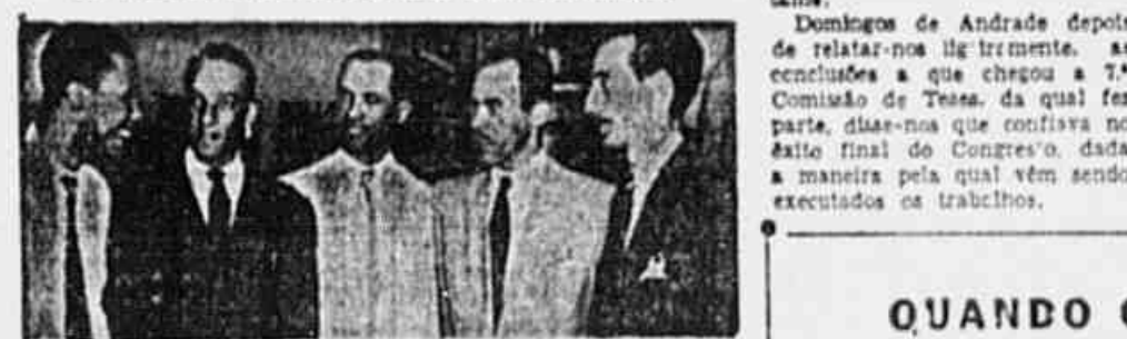
Delegados cariocas ao Congresso Sindical quando falavam ao redator

É o que afirmam delegados cariocas, participantes do Congresso Sindical, em visita à TRIBUNA POPULAR — A criação da CTB fortalecerá a democracia