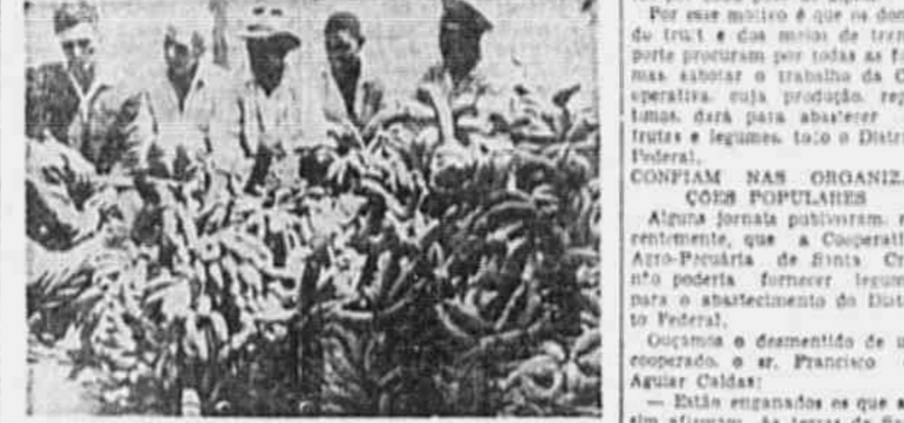
Cooperados, quando ferozam das grandes possibilidades da Cooperativa Agro-Pecuária de Santa Cruz

decididamente na luta contra a carestia de vida, os grupos de mulheres se organizam para lutar contra a falta de gêneros e a alta dos preços.