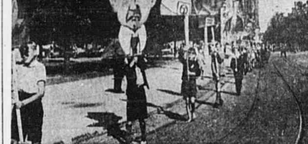
A ALEMANHA DESPERTA PARA A DEMOCRACIA - Eis aí um aspecto da propaganda eleitoral na zona de ocupação soviética...