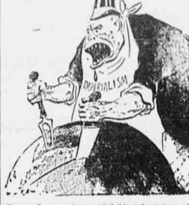
Está como Gropper, o famoso caricaturista norte-americano, em o imperialismo...