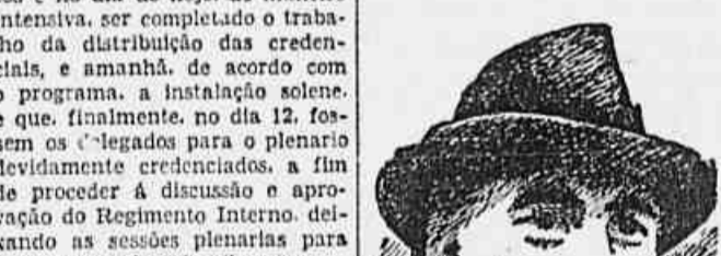
Dimitroff, heroi do povo búlgaro

Stalin passou em revista as forças blindadas MOSCOW, 8 (U.P.) — O generalíssimo Stalin passou em revista as forças blindadas soviéticas que desfilaram pela Praça Vermelha. Stalin achava-se acompanhado dos membros do Politburo, dos líderes do governo e dos membros militares. Os únicos estrangeiros convidados para a sessão no desfile das forças blindadas soviéticas foram os membros da milícia militar tcheco-eslovaca e os correspondentes estrangeiros sediados nesta capital.