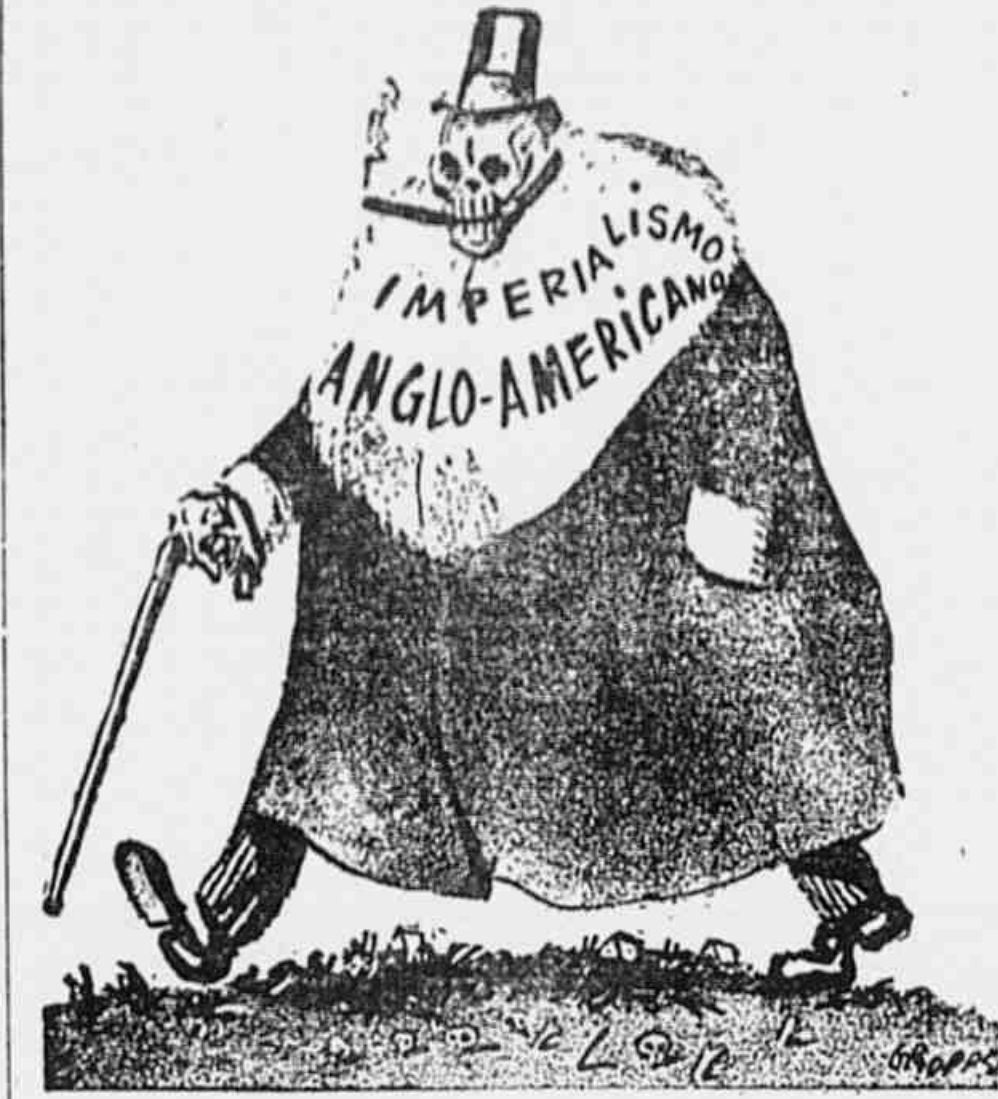
Ele como o famoso caricaturista Gropper vê o imperialismo anglo-americano, hoje tão desesperado.

Quais são as forças econômicas e políticas norte-americanas interessadas em lançar os Estados Unidos numa terceira guerra mundial? Não é difícil identificá-las. No campo do capital financeiro elas são representadas pelos chamados "Big 8": os oito grandes monopolistas que dominam toda a economia estabelecida, os Morgan, Rockefeller, Kuhn-Loeb, Mellon, Chicago-Group, DuPont, Cleveland-Group e Boston Group.