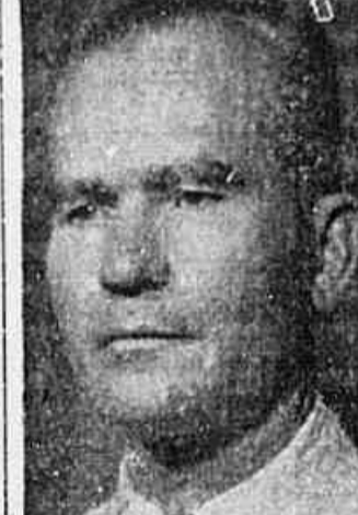
Deputado Gregorio Bezerra