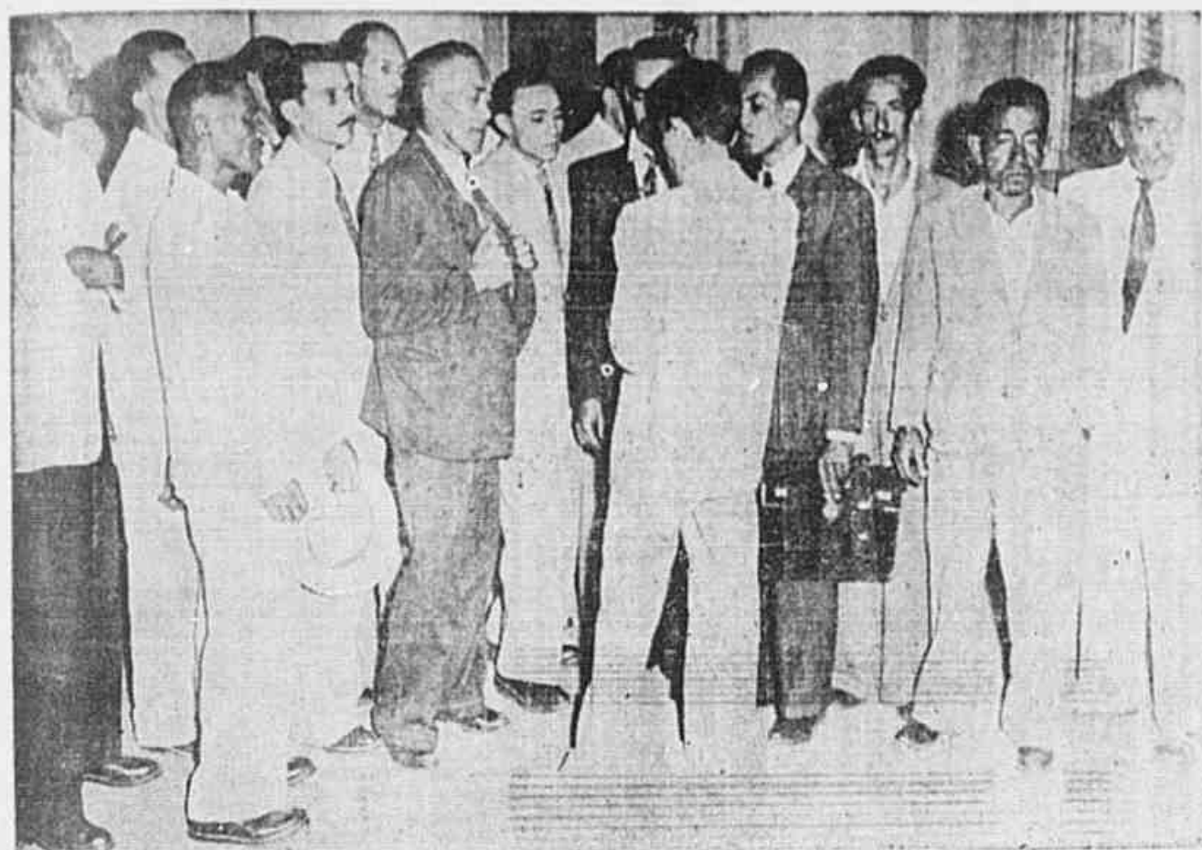
Populares falando á nossa reportagem sobre a Conferência Nacional do PCB

Aproximam-se o dia da instalação da Conferência Nacional do PCB, um acontecimento cuja importância ainda ontem foi ressaltada através da palavra de Luiz Carlos Prestes e outros dirigentes comunistas que falaram á nossa reportagem. Um deles afirmou: "O povo está de olhos postos para esta Conferência".