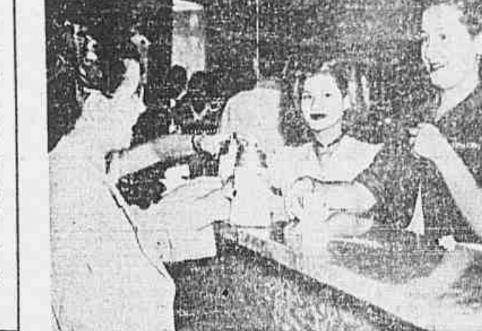
Agora, o carioca está ameaçado de ficar sem o "cafezinho"