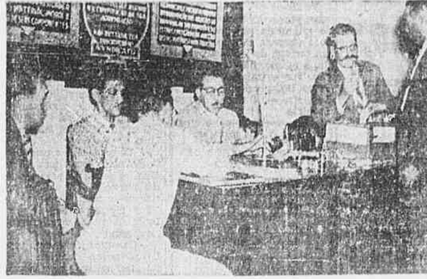
Um aspecto da votação secreta, ontem à noite, no Sindicato dos Padeiros, quando um associado introduzia o seu voto na urna.

ção da referida previsão orçamentária, sendo distribuídos aos associados envelopes e cédulas com as direções "sim" e "não". Baseou-se a diretoria do Sindicato dos Padeiros para que a eleição alegando que essa importância era exagerada para fazer face às despesas da organização. Travaram-se agitados debates entre os oradores da assembleia e diretores do Sindicato, que falaram a linguagem da classe que a do Ministério do Trabalho, a quem zermem de olhos fechados