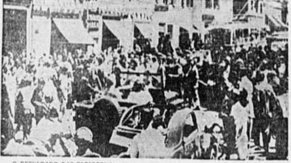
O resultado das eleições na Itália, favorável à República, fez com que os reacionários monarquistas, desconhecendo a vontade da maioria expressa nas urnas, saíssem à rua, provocando o caos e o conflito. Os provocadores monarquistas, no seu ódio ao povo e à forma de governo democrático, incitem de preferência contra as organizações do Partido Comunista Italiano, pois sabem que foi o Partido de Mussolini o principal responsável da grande vitória que representa uma etapa histórica decisiva na vida política da Itália. É o início de uma derrota demonstrativa de detestáveis reacionários monarquistas e dos restos feixistas intervenidos na derrota, que a fotografia ao alto fixa. Vêem-se soldados da Polícia Militar norte-americana, em "festa", dispersando os manifestantes.

ANO II * N.º 325 * QUINTA-FEIRA, 13 DE JUNHO DE 1930