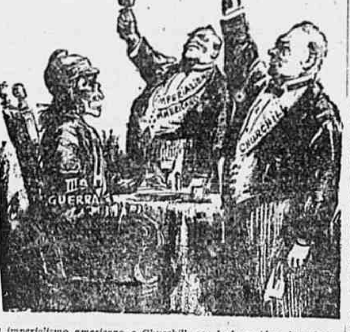
O imperialismo americano e Churchill, seu leal servidor, levantam um brinde à terceira guerra mundial, que eles e os reacionários do mundo inteiro pretendem desencadear

— Sob o título "O Arsenal Imperialista", o jornal "La Hora" publica o seguinte editorial: "Um dos sinais mais perigosos e ameaçadores do pós-guerra, é o projeto Truman levado ao Congresso e pelo qual a América Latina ficaria transformada em um batalhão do Exército dos Estados Unidos. Por esse projeto os Estados Latino-americanos ver-se-iam aliados aos interesses bélicos do imperialismo norte-americano. Pelo tratado de "cooperação" militar inter-americano surgido naquele documento criminoso a unidade militar pan-americana, sob a hegemonia — francamente declarada no projeto — dos Estados Unidos. Os países latino-americanos, incompletamente desenvolvidos em virtude da expressão do capital estrangeiro, que assistiu e afina suas possibilidades de evolução econômica independente, deixariam de poder realizar uma defesa nacional ao serviço da possibilidade dessa evolução independente, para serem rotas inconscientes da maquinaria bélica do imperialismo norte-americano. A "cooperação"