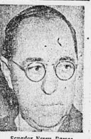
Senador Nereu Ramos

Uma organização que se diz "filantrópica e altruista", promete extrações de dentes sem dor, limpeza da boca, e explora a industria do "anti-comunismo", a dez cruzeiros por cabeça, além de outras contribuições "espontaneas"