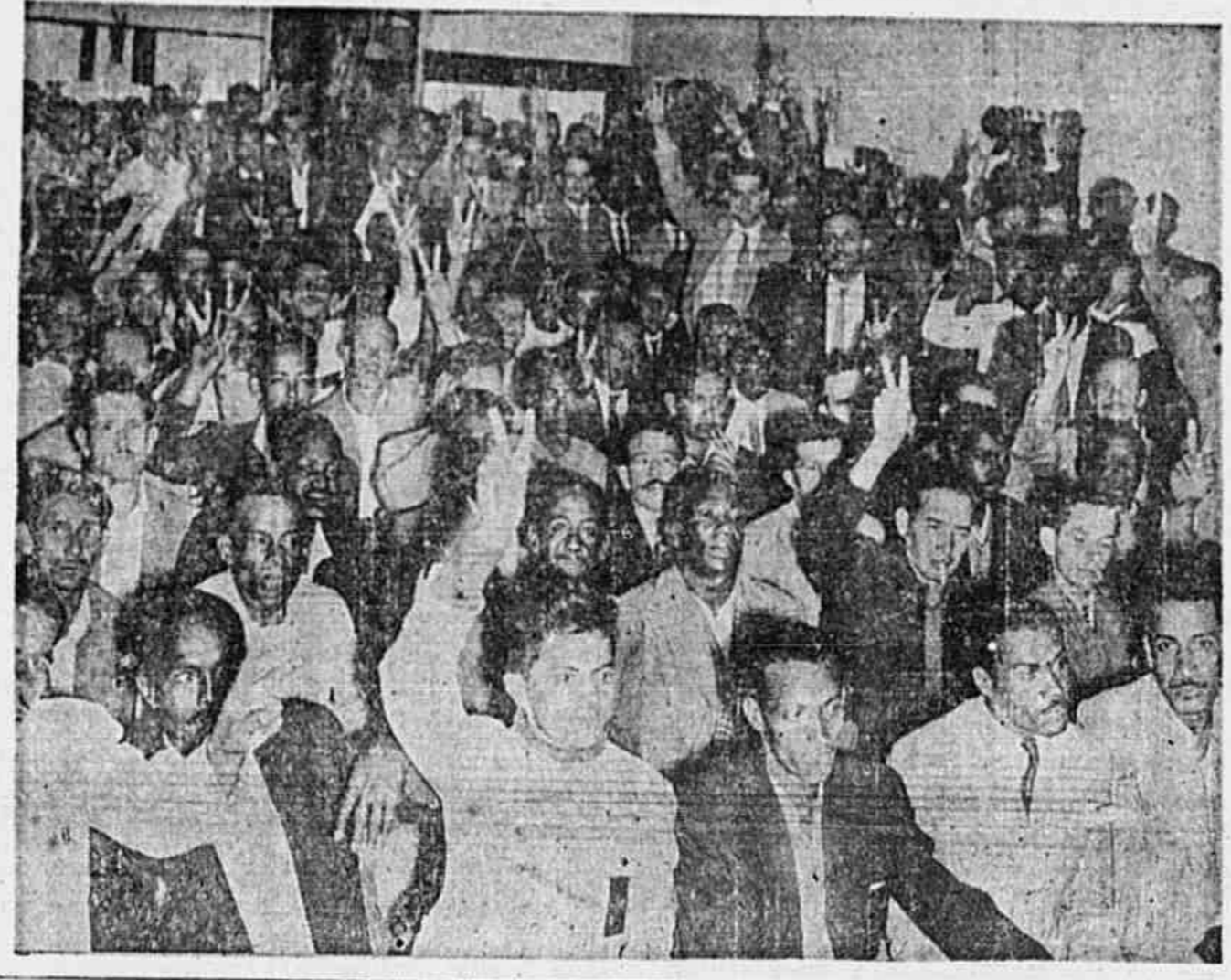
Está aqui um flagrante da enérgica assembleia que os portuarios cariocas realizaram, ontem à noite, na sede do Sindicato dos Marinheiros. Tendo à frente o Comitê Democrático dos Portuarios, esses numerosos trabalhadores formularam suas mais urgentes reivindicações e reafirmaram sua firme disposição de continuar boicoteando os navios do fascista Franco. (Lêa reportagem na 2.ª página.)

ANO II ☆ N.º 325 ☆ QUINTA-FEIRA, 13 DE JUNHO DE 1946