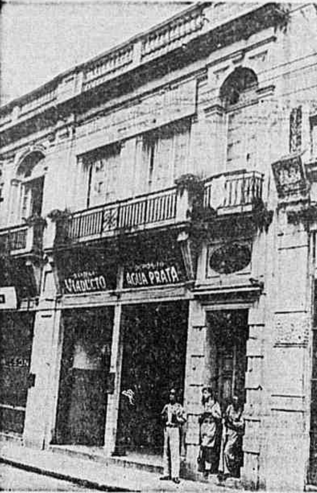
A sede da União G. S. T. S. dos Trabalhadores de Santos, "guardada" por soldados da Polícia Militar