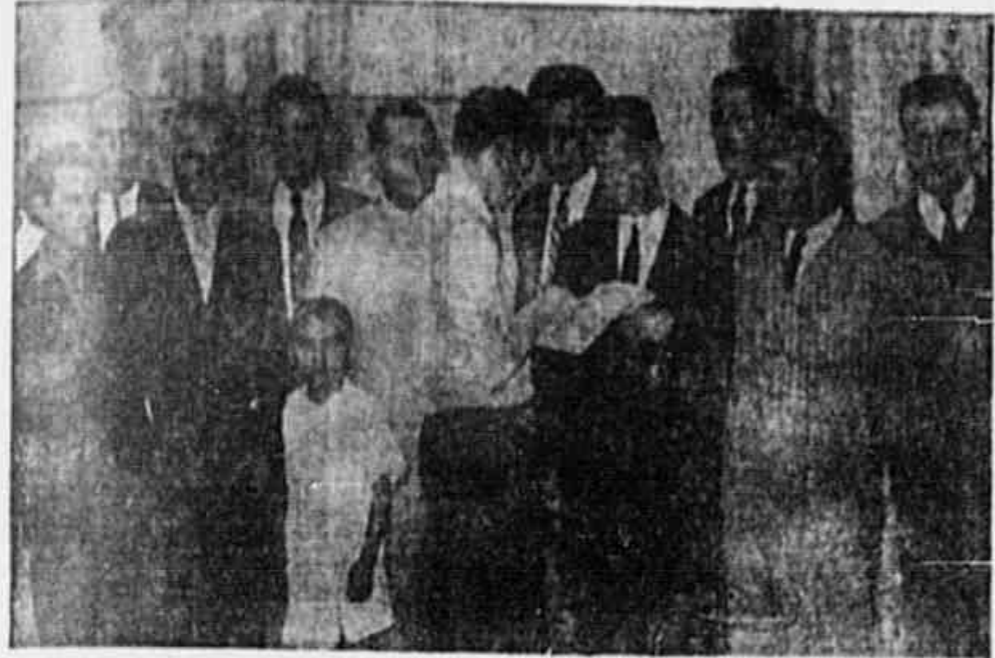
Comissão da Associação Profissional dos Ferrovários do E. F. C. B. em nossa redação

Direito de sindicalização e outras reivindicações defendidas por deputados democratas