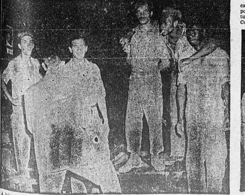
A fotografia acima mostra alguns operários da Construção Civil falando á nossa reportagem

Incliamos, dias atrás, a publicação dos dispositivos mais importantes do projeto de Constituição elaborado pela Comissão Constitucional e que já desceu ao