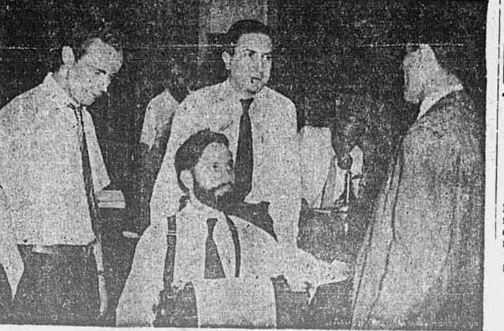
Journalistas da "United Press" falam á TRIBUNA POPULAR sobre o projeto de Constituição

pleno da Assembléa Constituinte, para submeter-se a debate, receber emendas e finalmente ser aprovada. Trata-se de um