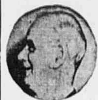
Philip Murray, dirigente da C. I. O.

ANO II ☆ N.º 322 ☆ DOMINGO, 9 DE JUNHO DE 1946