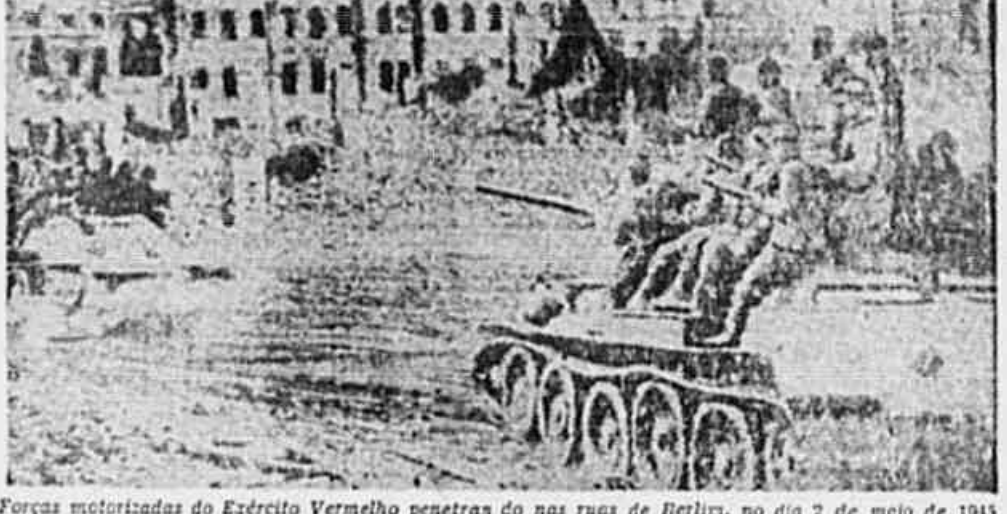
Forças motorizadas do Exército Vermelho penetram nas ruas de Berlim, no dia 2 de maio de 1945