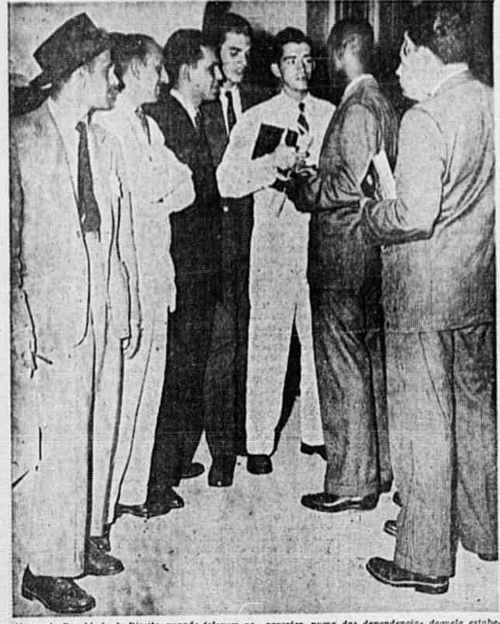
Alunos da Faculdade de Direito, quando falavam ao repórter, numa das dependências daquele estabelecimento de ensino

ANO II N.º 291 SABADO, 5 DE MAIO DE 1946