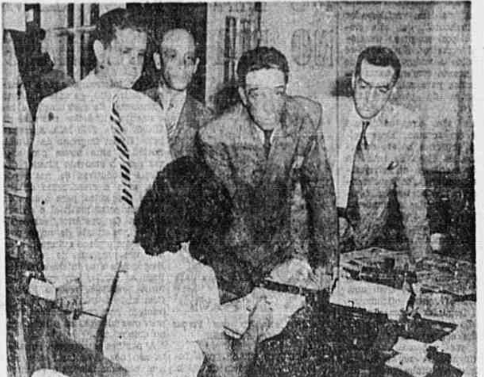
A Comissão de Salários do Sindicato dos Ferroviários quando, em nota redação, falava acerca da campanha em que se empenham os 14.000 explorados pela empresa imperialista