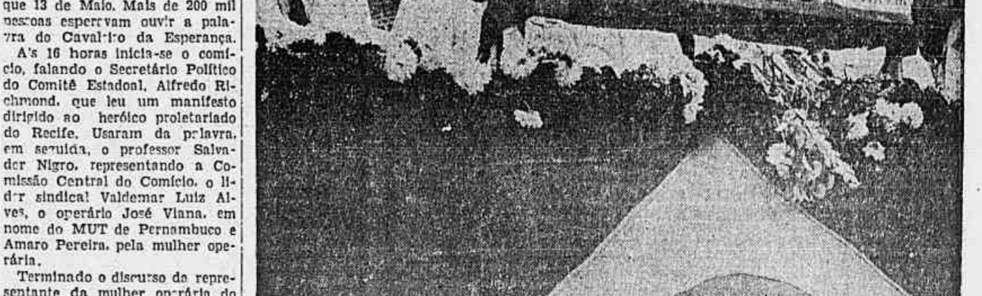
Outro flagrante de Luiz Carlos Prestes falando no Recife

Depois de amanhã deverá realizar-se em Campos, no Estado do Rio, um comício em homenagem ao Senador Luiz Carlos Prestes. Essa festa foi transferida para o